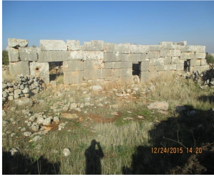
اضرار ناتجة عن التنقيب العشوائي