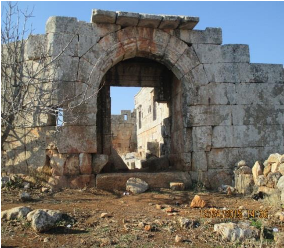
اضرار ناتجة عن التنقيب العشوائي