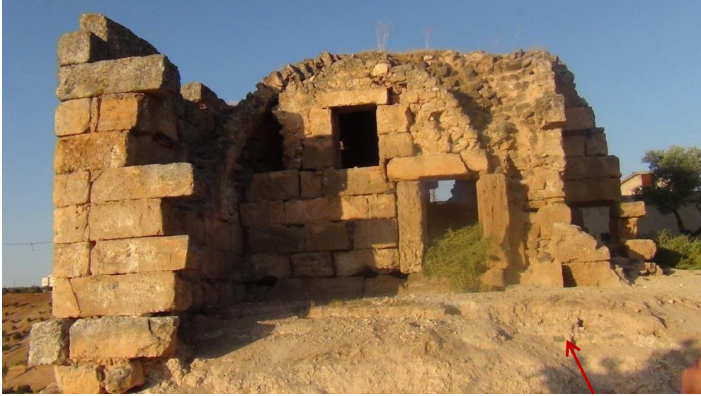
الواجهة من الجهة الغربية يظهر فيها بعض أعمال التنقيب الغير شرعي