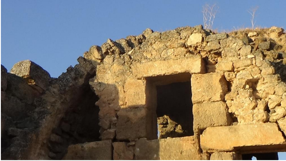
اضرار ناتجة عن العوامل الجوية من الجهة الغربية اعلى البناء