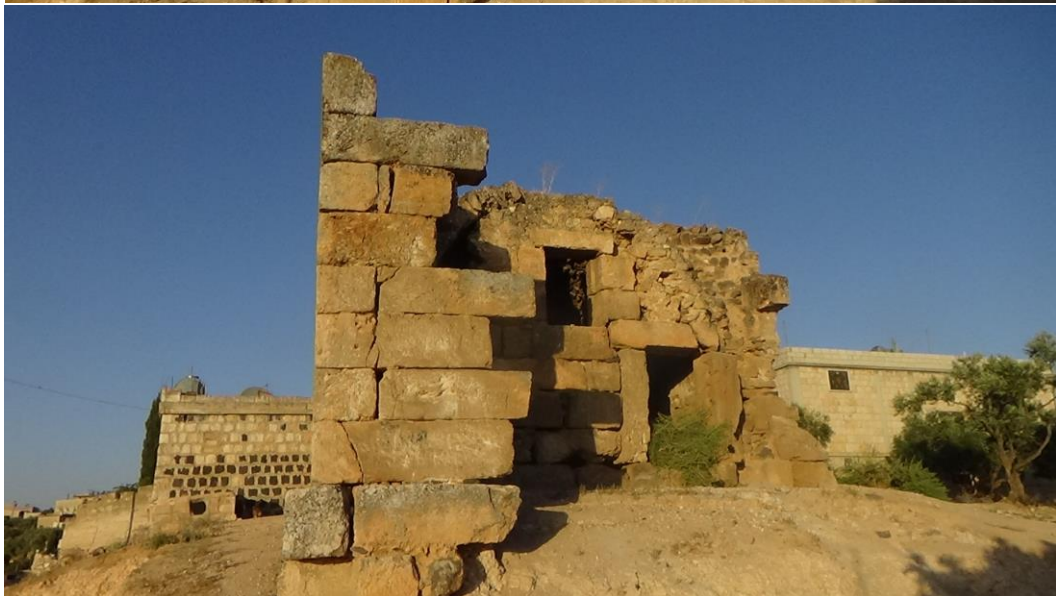
بعض الاضرار ناتجة عن الاهمال للبناء وظهور أعشاب ضارة