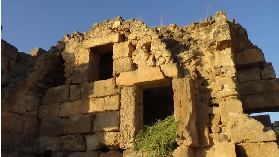
الجهة الجنوبية للبناء ويظهر عليها بعض الاضرار ناتجة عن العوامل الجوية و الاهمال