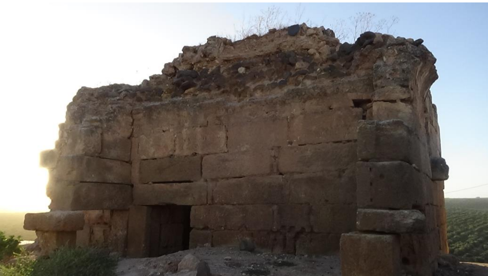
البناء من الجهة الجنوبية