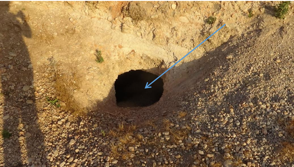
البناء من الجهة الشمالية وهناك تنقيب غير شرعي