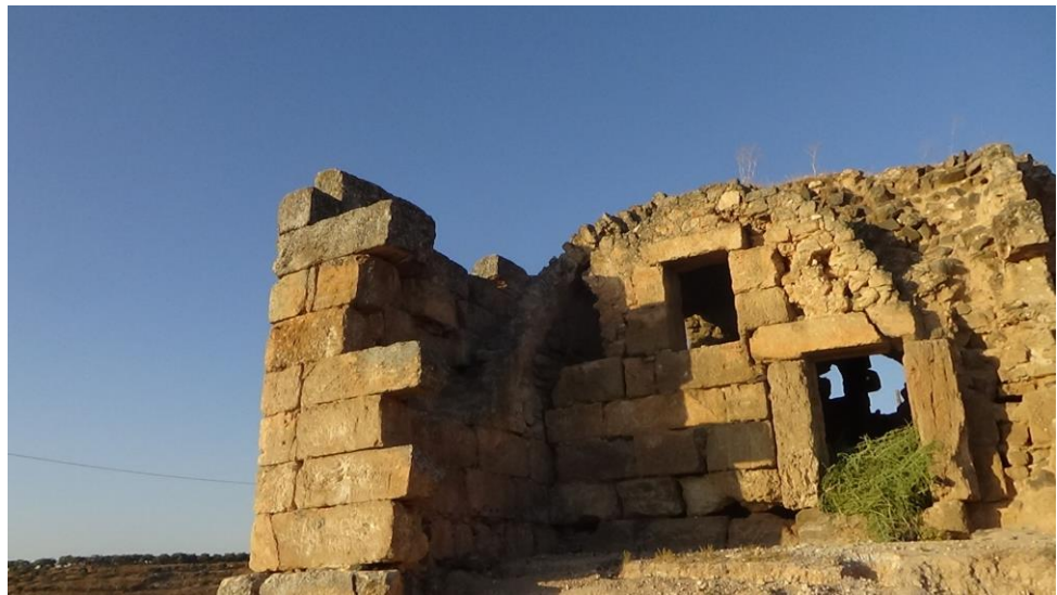
اضرار ناتجة عن العوامل الجوية