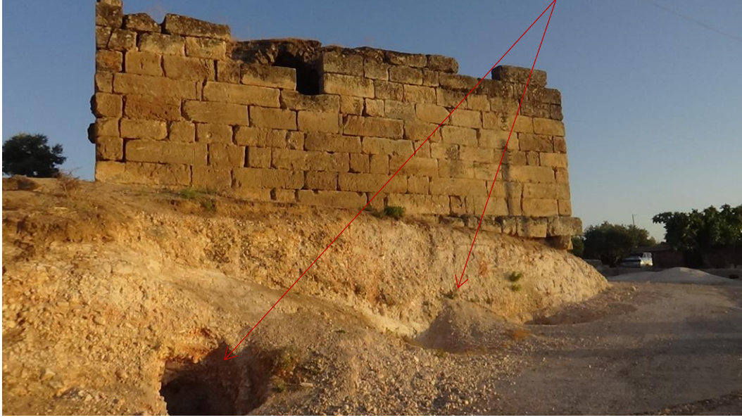
البناء من الجهة الشمالية ويظهر التنقيب تحت البناء

وقد قمنا نحن أعضاء مركز حماية التراث الثقافي السوري بتوثيق وتقييم الأضرار في هذا القصر بتاريخ 6/7/2017 ويلحق بهذا التقرير مجلد صور يظهر التعدادات والحفريات والأضرار الطبيعية نتيجة العوامل الجوية.