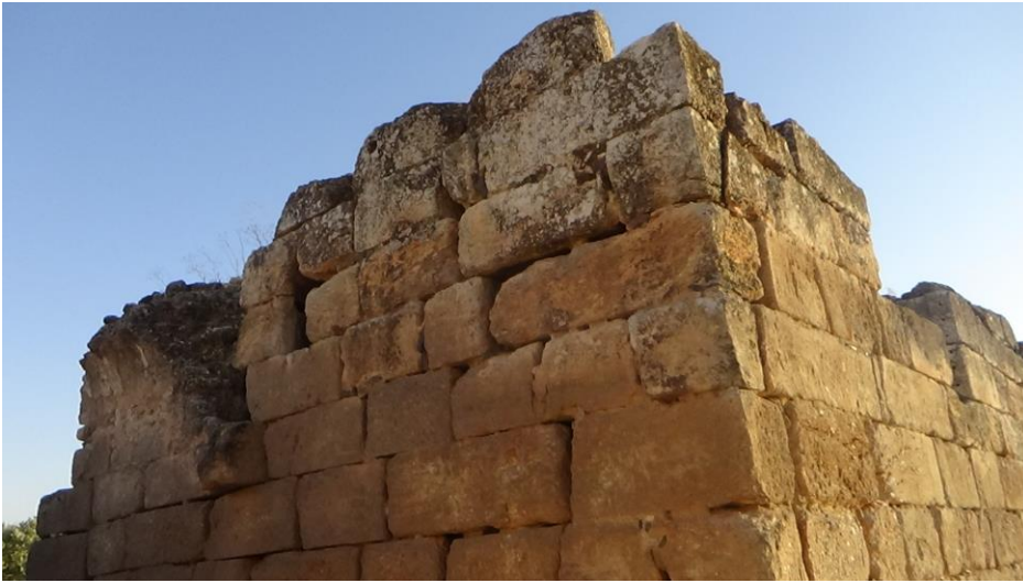
الجهة الشمالية الشرقية زاوية البناء