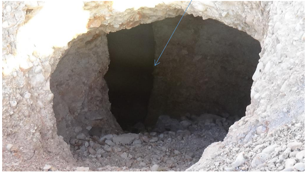
داخل حفرة التنقيب من الجهة الشمالية