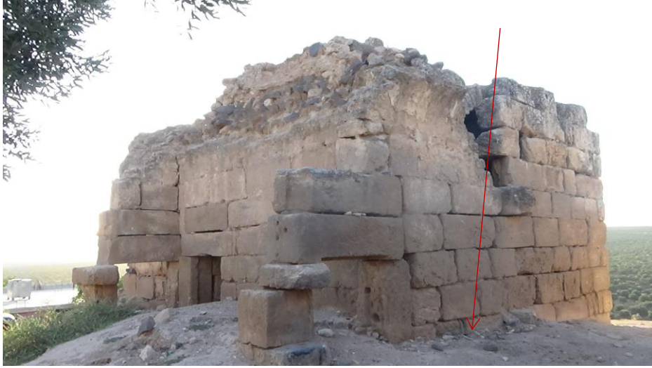
الجهة الشرقية ايضا هناك تنقيب غير شرعي ولكن بسيط