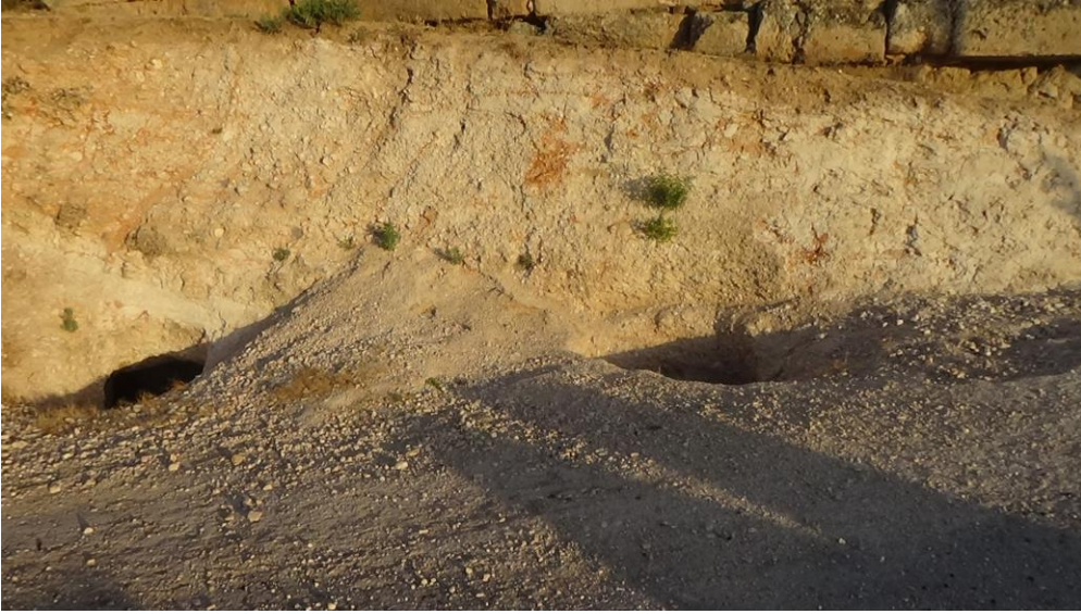
تنقيب غير شرعي من الجهة الشمالية