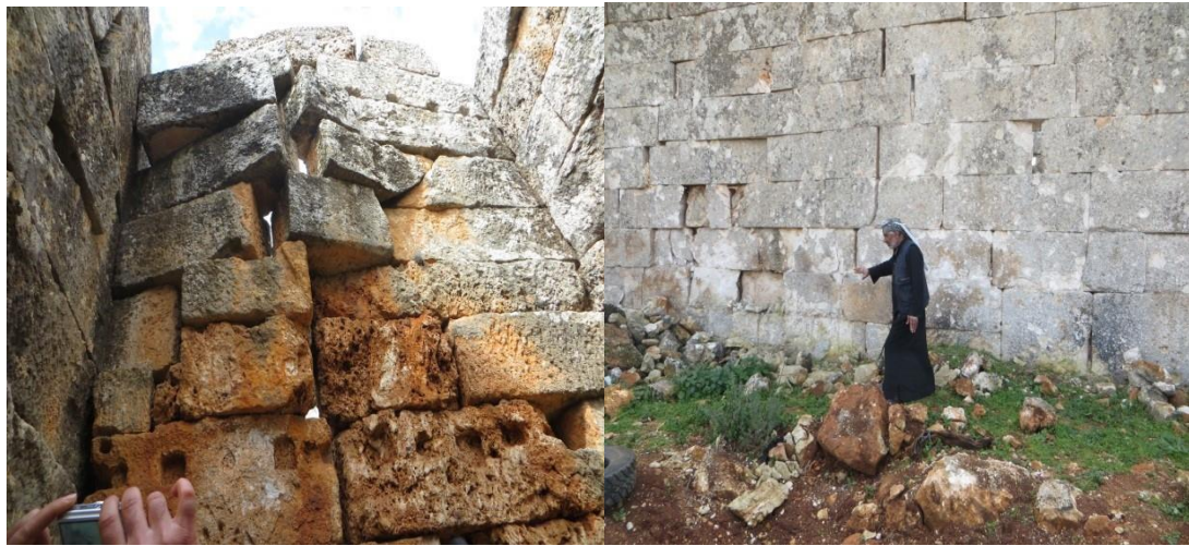
مكان تنفيذ الطائرات التابعة لقوات النظام للغارة والأضرار على الجدران 2013