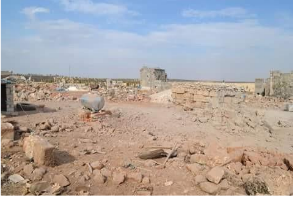
الأضرار الكبيرة على الموقع الأثري من الموقع من الجهة الشرقية