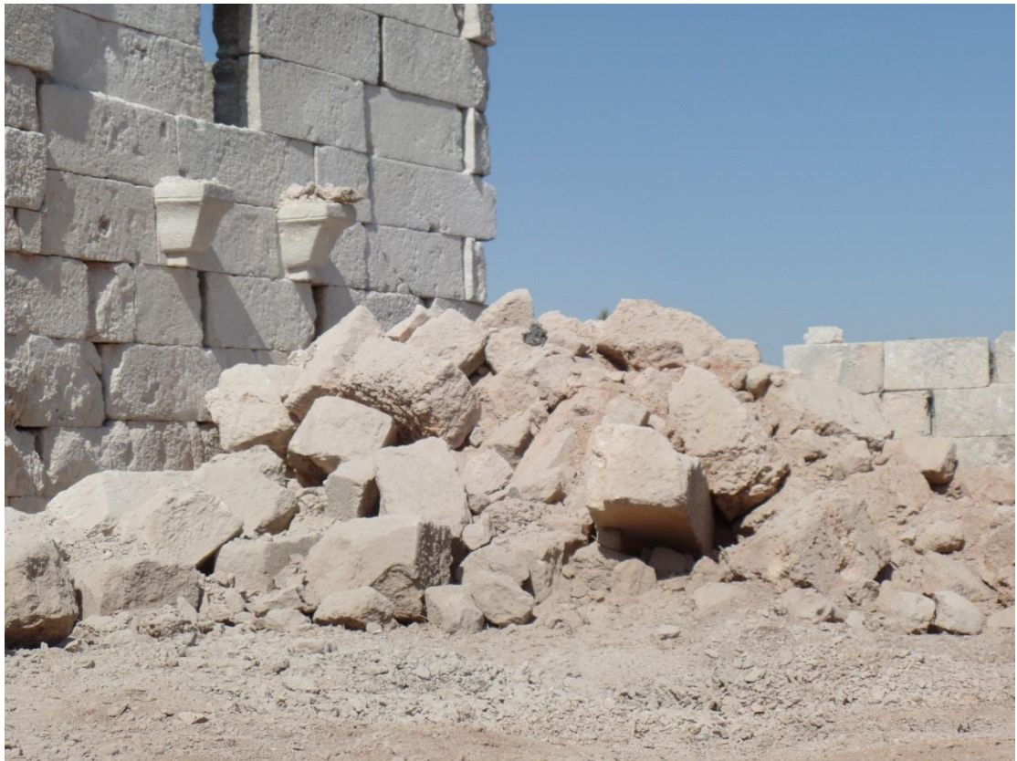
انهيار بناء بشكل كامل