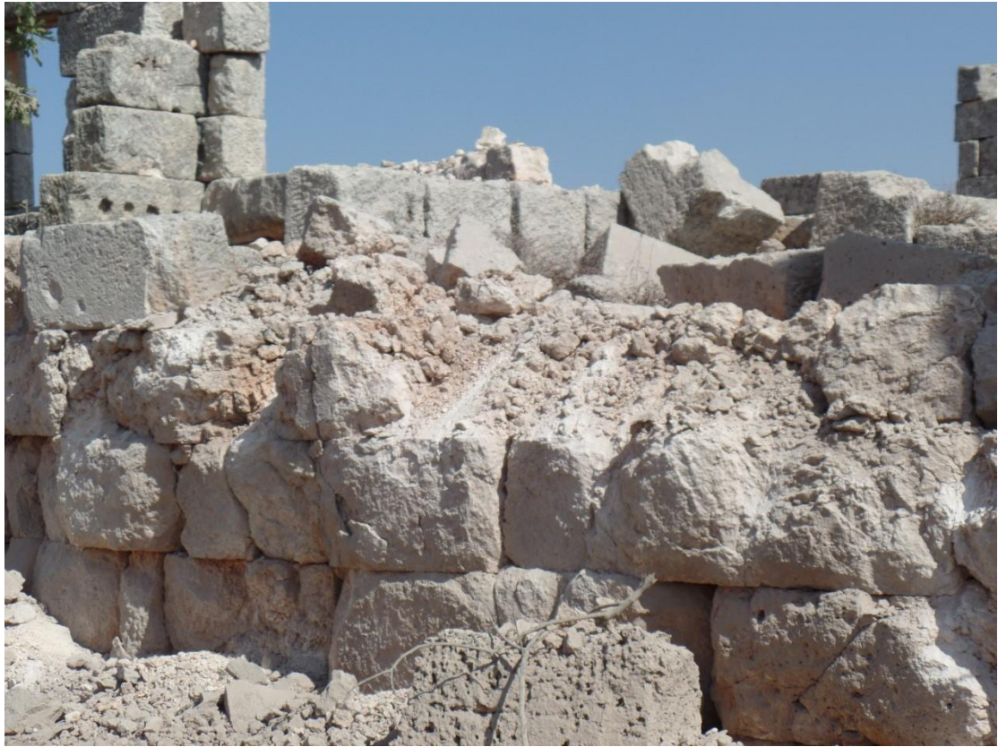
انهيار بناء بشكل كامل