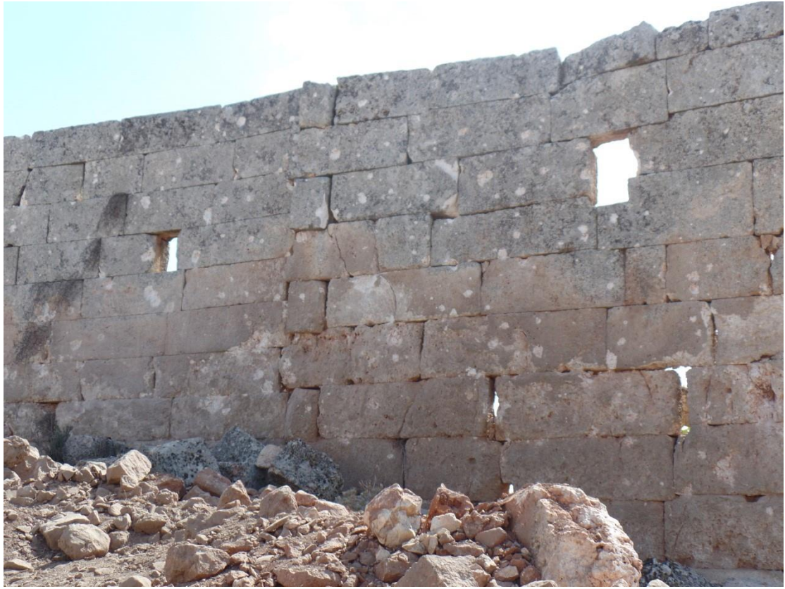
اضرار في الجدران