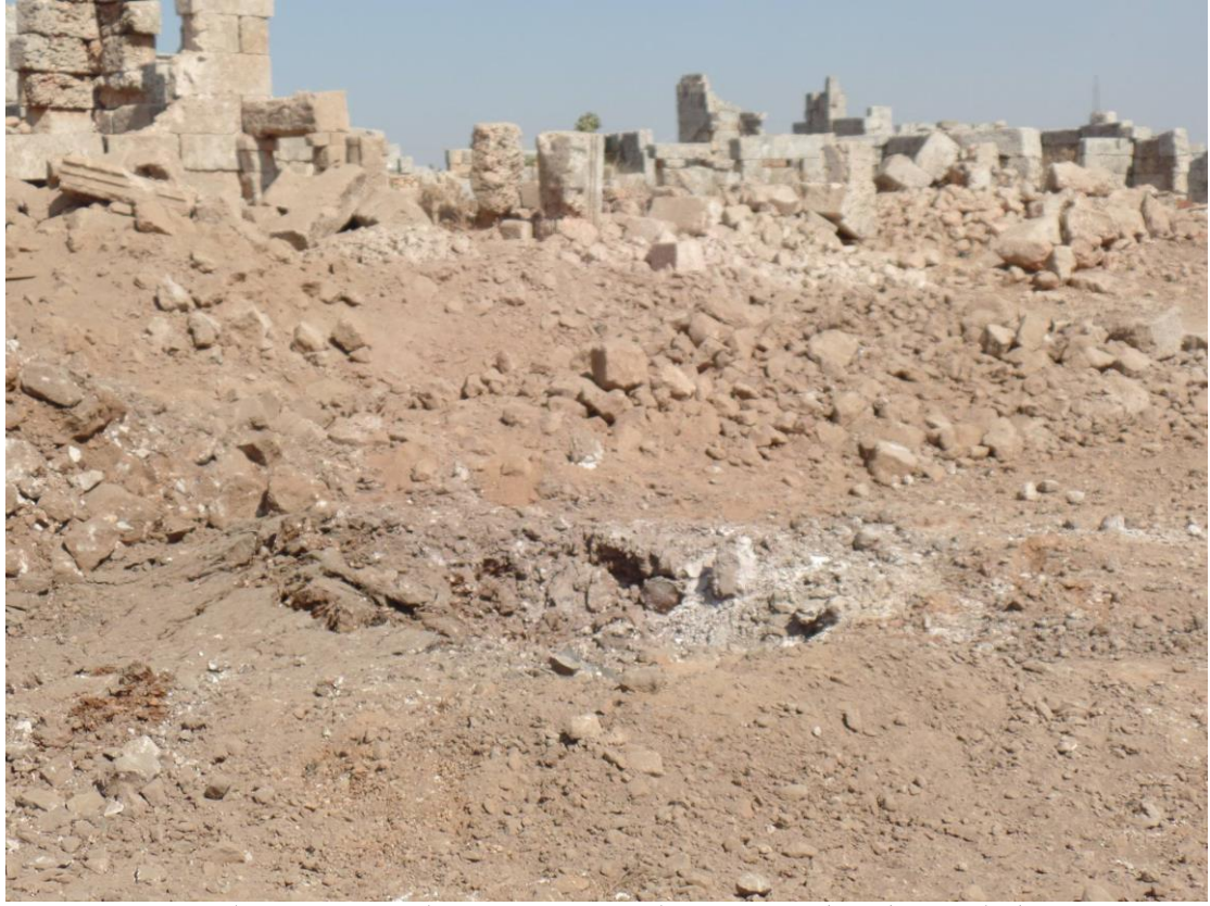
زوال البناء بشكل كامل مكان سقوط الصاروخ والاضرار الكبيرة في الابنية المجاورة