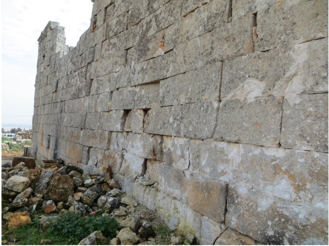
مكان تنفيذ الطائرات التابعة لقوات النظام للغارة والأضرار على الجدران 2013

فيما يلي صور تظهر حجم الدمار الذي حل بالأبنية جراء القصف الروسي