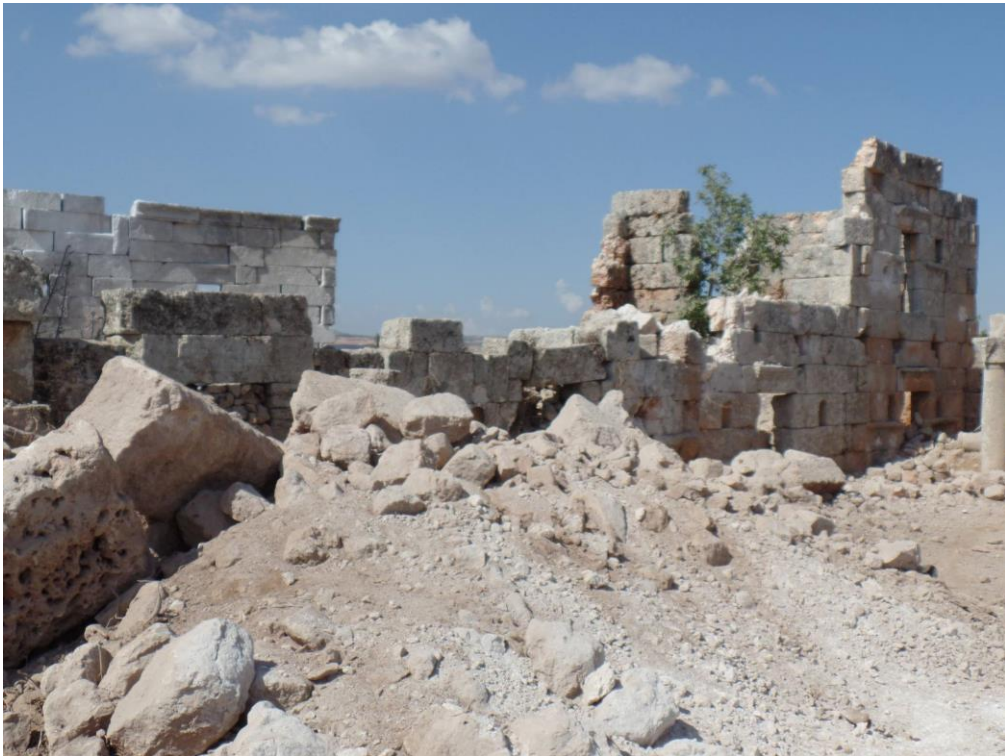
زوال البناء بشكل كامل مكان سقوط الصاروخ والاضرار الكبيرة في الابنية المجاورة