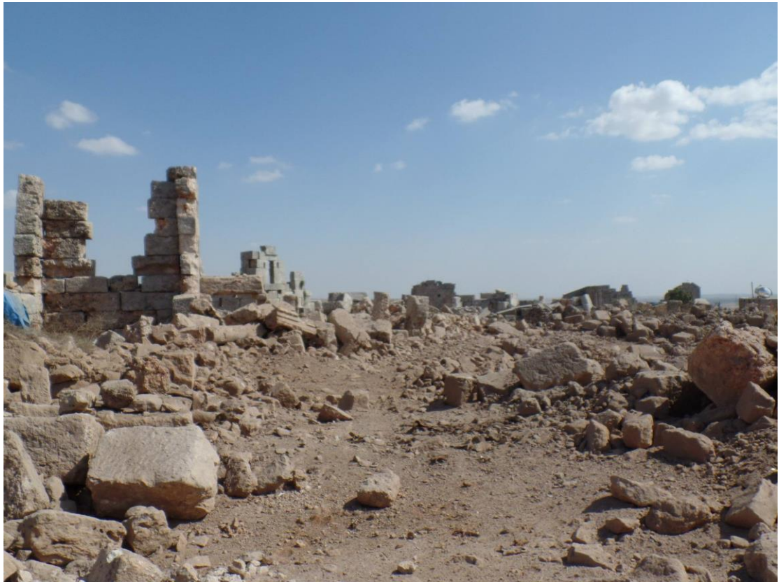
زوال البناء بشكل كامل مكان سقوط الصاروخ والاضرار الكبيرة في الابنية المجاورة