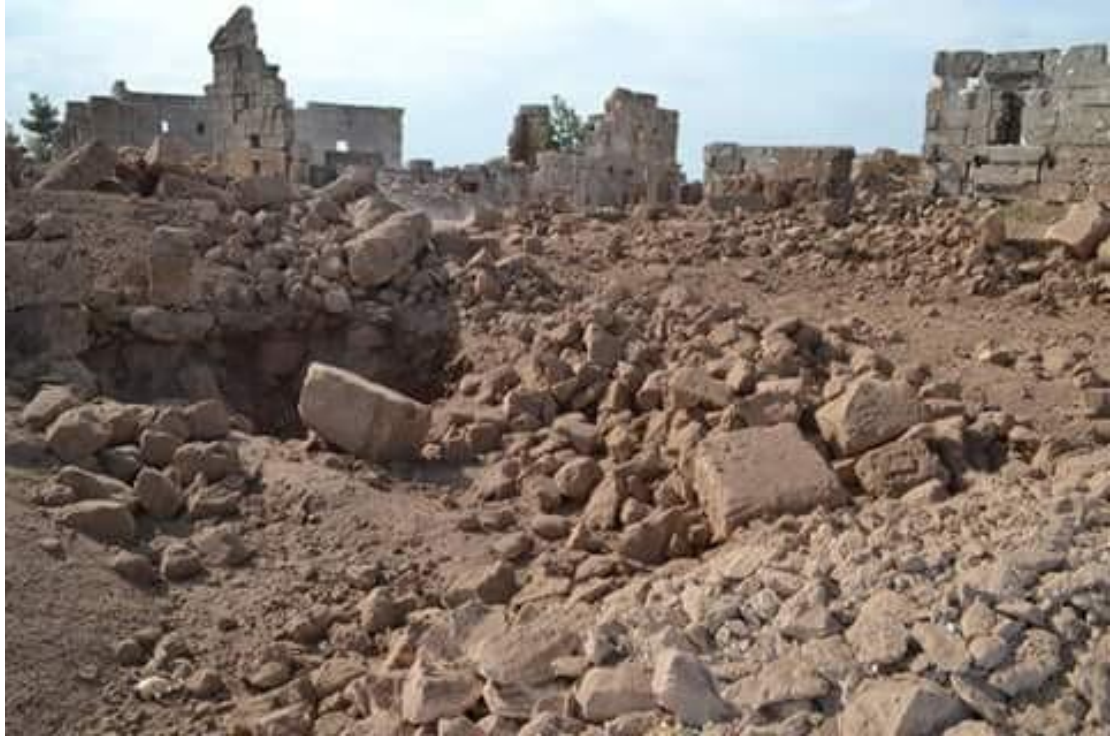
مكان تنفيذ غارة الطيران الروسي والأضرار الكبيرة على الموقع الاثري من الجهة الجنوبية الغربية

فيما يلي صور تظهر حجم الدمار الذي حل بالأبنية جراء القصف الروسي