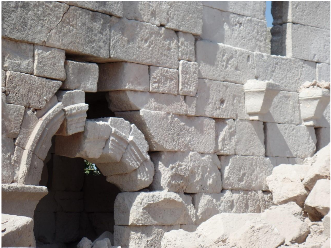
اضرار بالغة في الجدران وتحتاج لتدخل سريع وعمل إسعافي