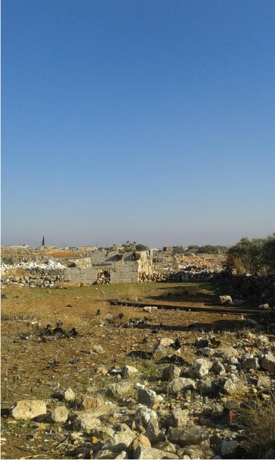
تكسير حجارة المباني الاثرية

- تكسير أحجار القصور والمباني الأثرية واستخدامها في الابنية الحديثة.