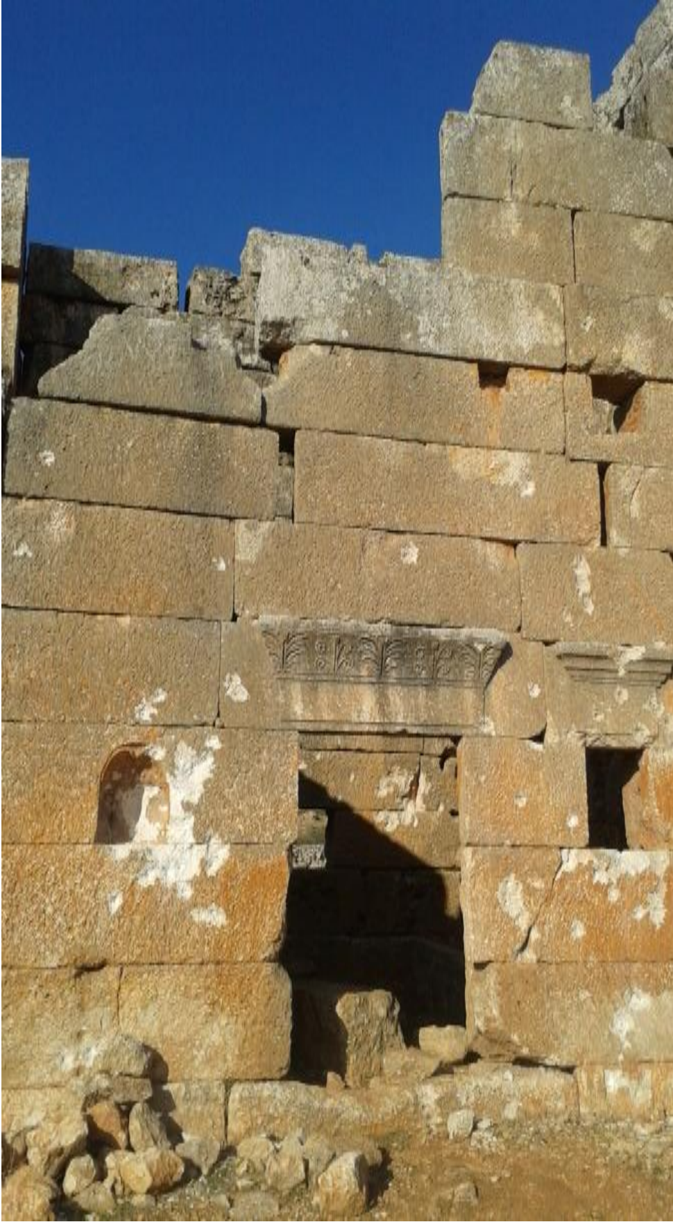
صورة تظهر الرصاص على جدار قصر سكني