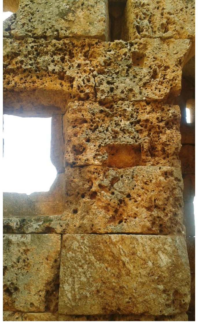
تأثيرات العوامل الجوية (الحت والتعرية) على الحجر