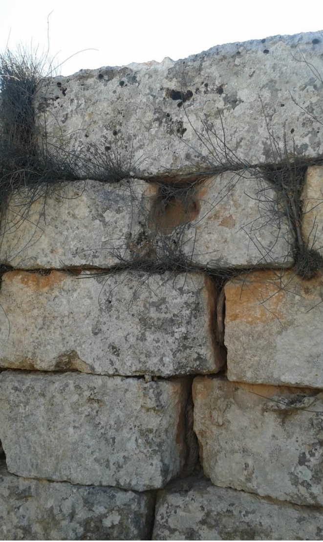
تأثيرات النباتات على الحجر