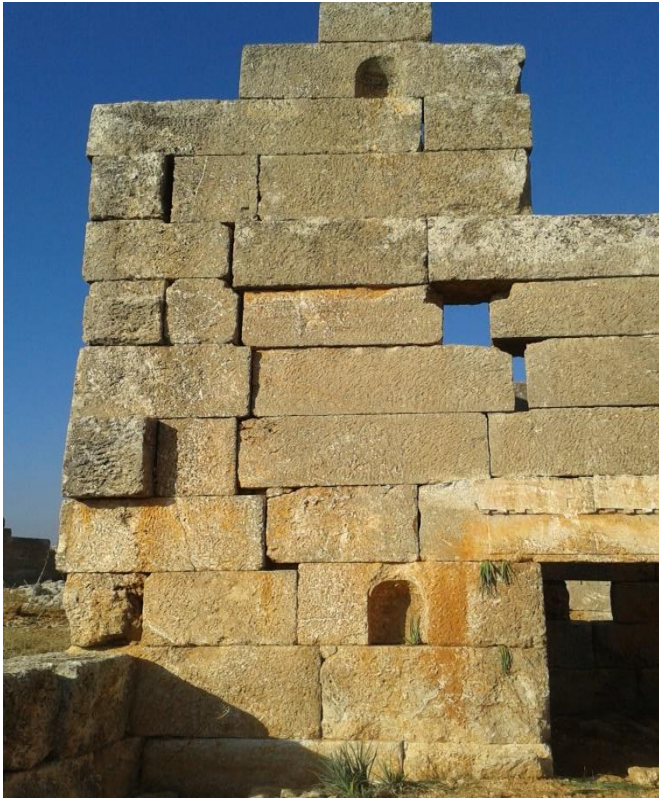
- قص وتشويه احد السواكف لباب قصر سكني بالمنشار الكهربائي.