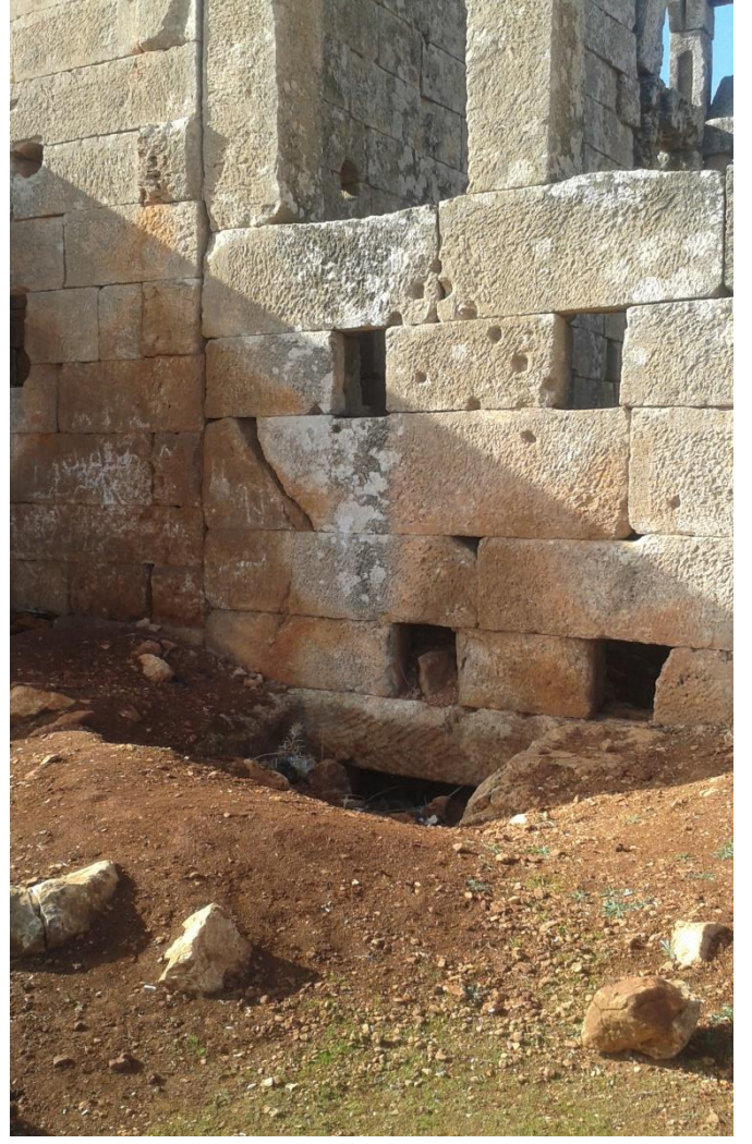
التنقيب الغير شرعي داخل احد المدافن الحجرية الارضية