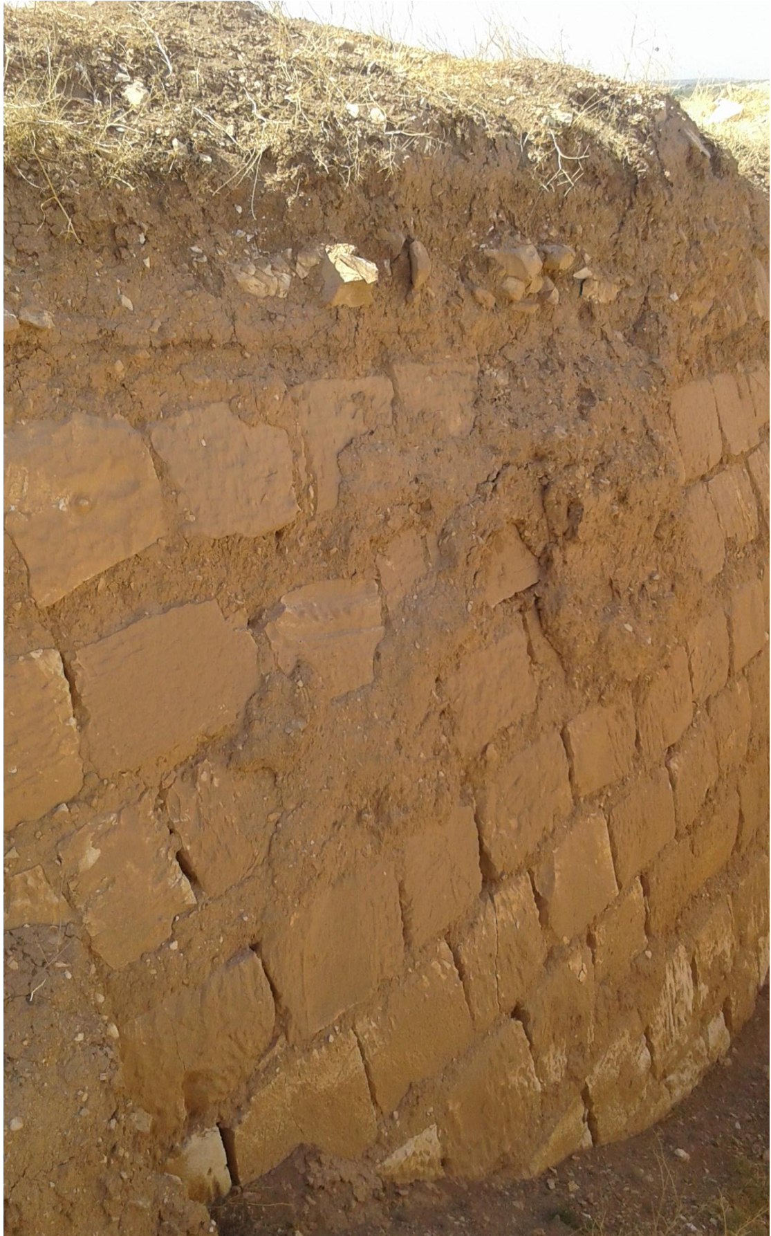
جدار ناتج عن اعمال التنقيب والجريف الغير شرعي