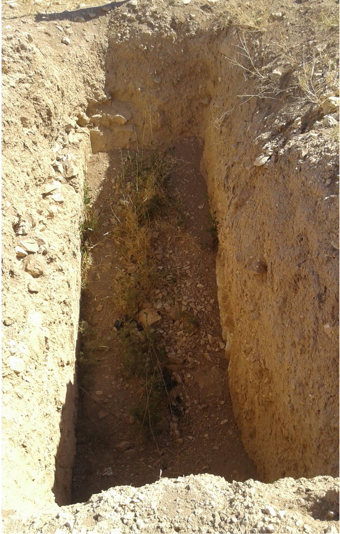
آثار التنقيب والجريف الغير شرعي من فترة سابقة