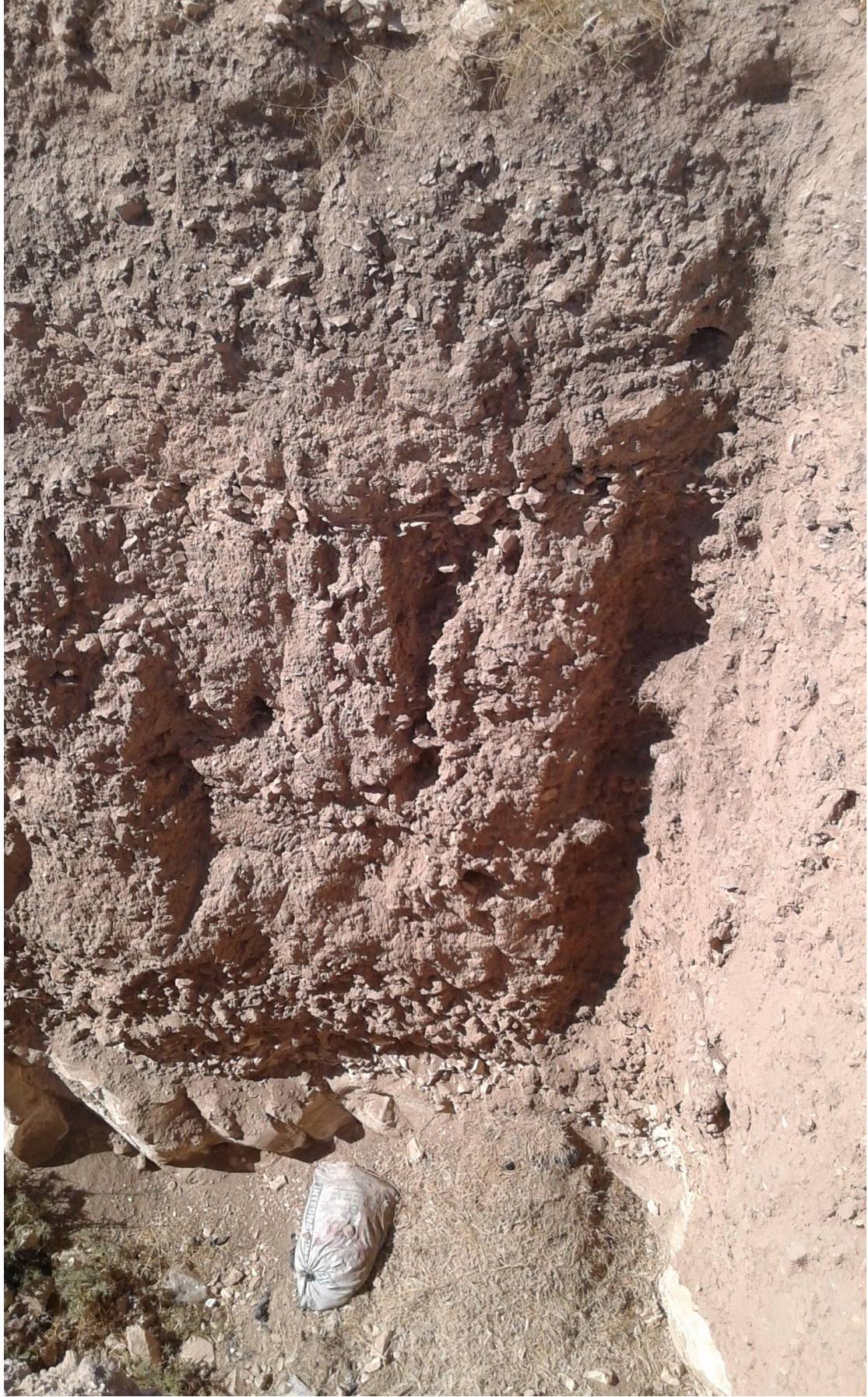
التل من الجهة الشمالية تظهر اثار التتقيب والجريف الغير شرعي