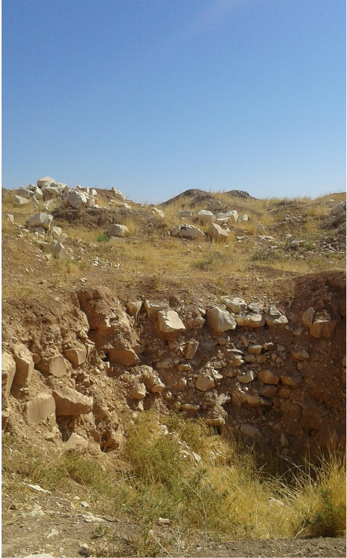
التل من الجهة شرقية تظهر اثار التنقيب والجريف الغير شرعي