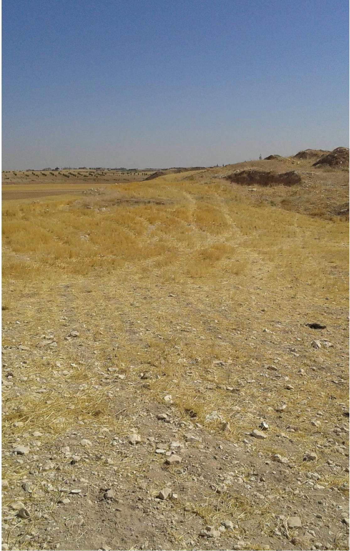
التل من الجهة الجنوبية تظهر اثار التنقيب والجريف الغير شرعي