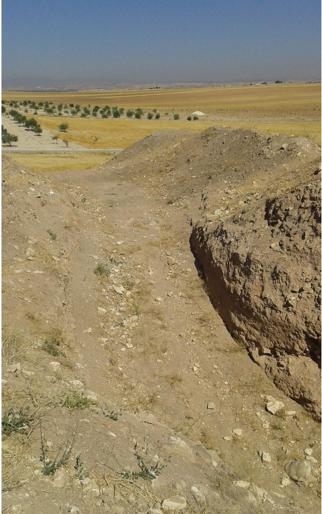
التل من الجهة الجنوبية تظهر اثار التتقيب والجريف الغير شرعي