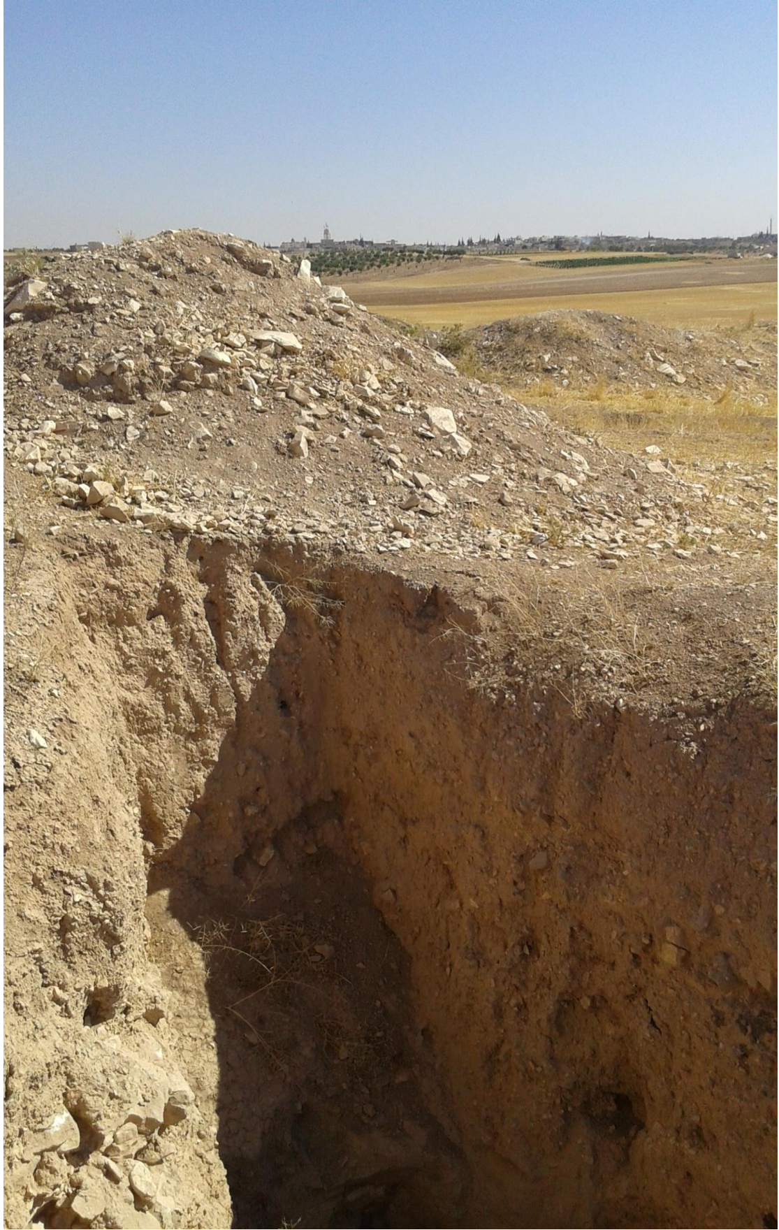
اثر التتقيب والجريف الغير شرعي من فترة سابقة