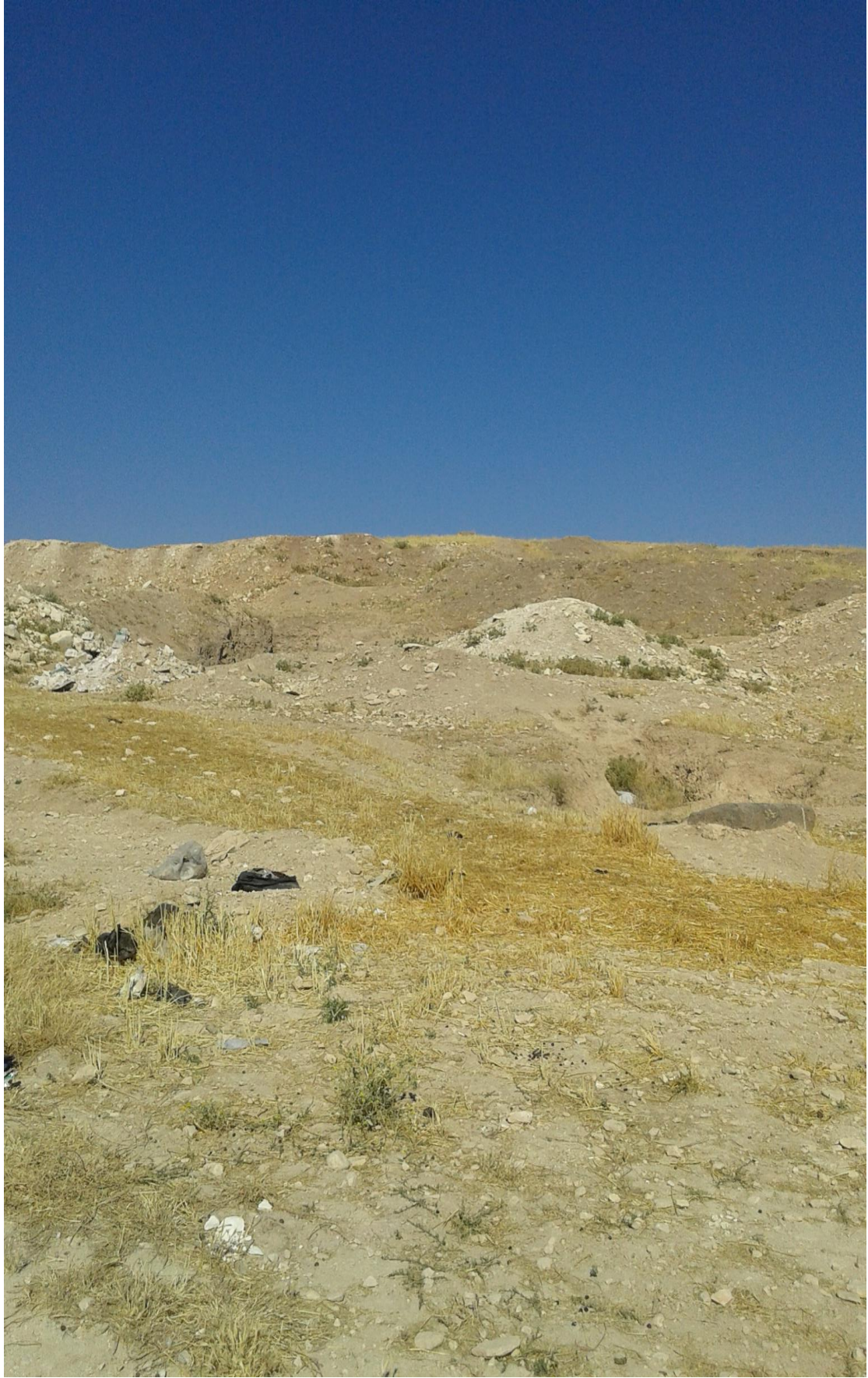
التل من الجهة الشمالية تظهر اثار التنقيب والجريف بشكل أكبر من الجهات الاخرى