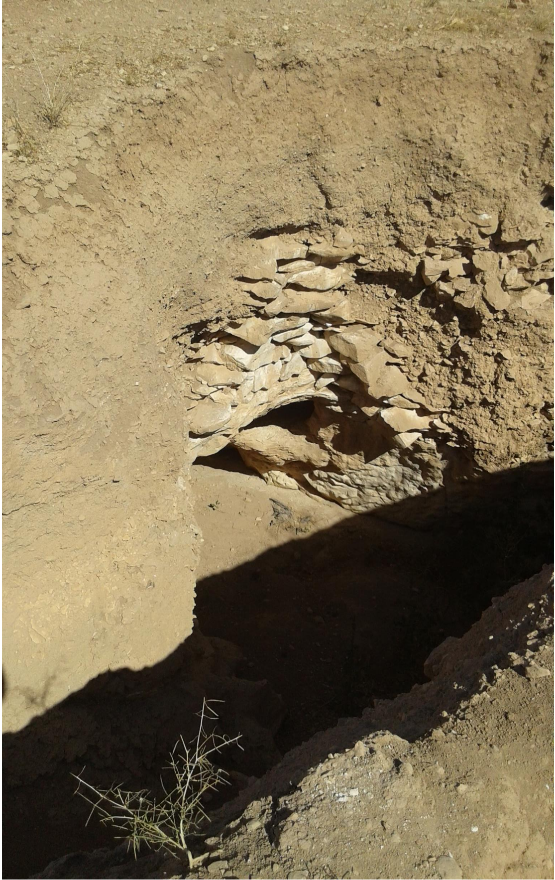
اثر التنقيب والجريف الغير شرعي وتخریب اساسات التل