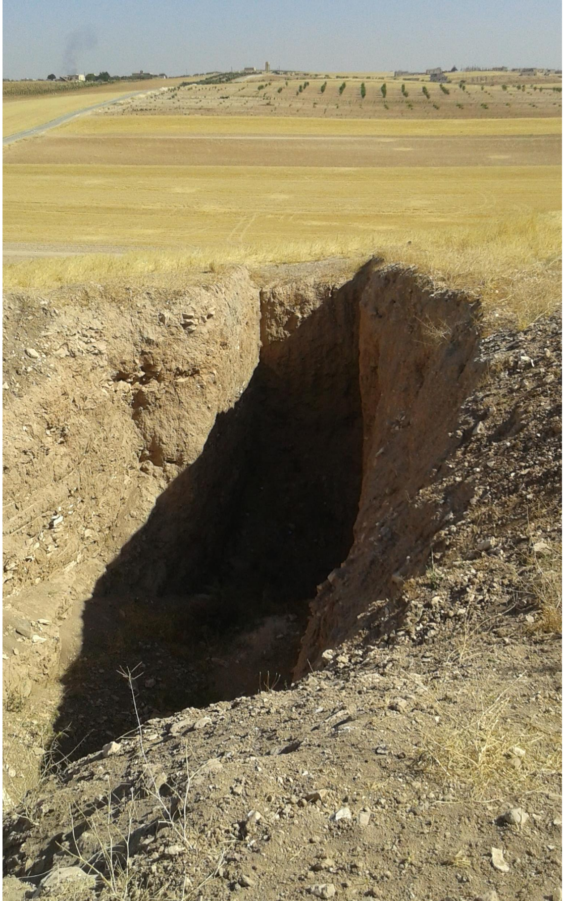
التل من الجهة الجنوبية شرقية تظهر اثار التنقيب والجريف الغير شرعي