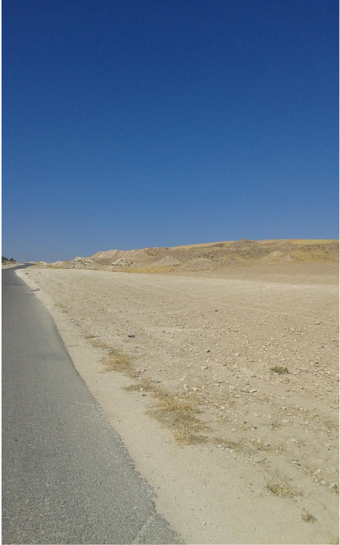
التل من الجهة الشمالية تظهر اثار التنقيب والجريف بشكل أكبر من الجهات الاخرى