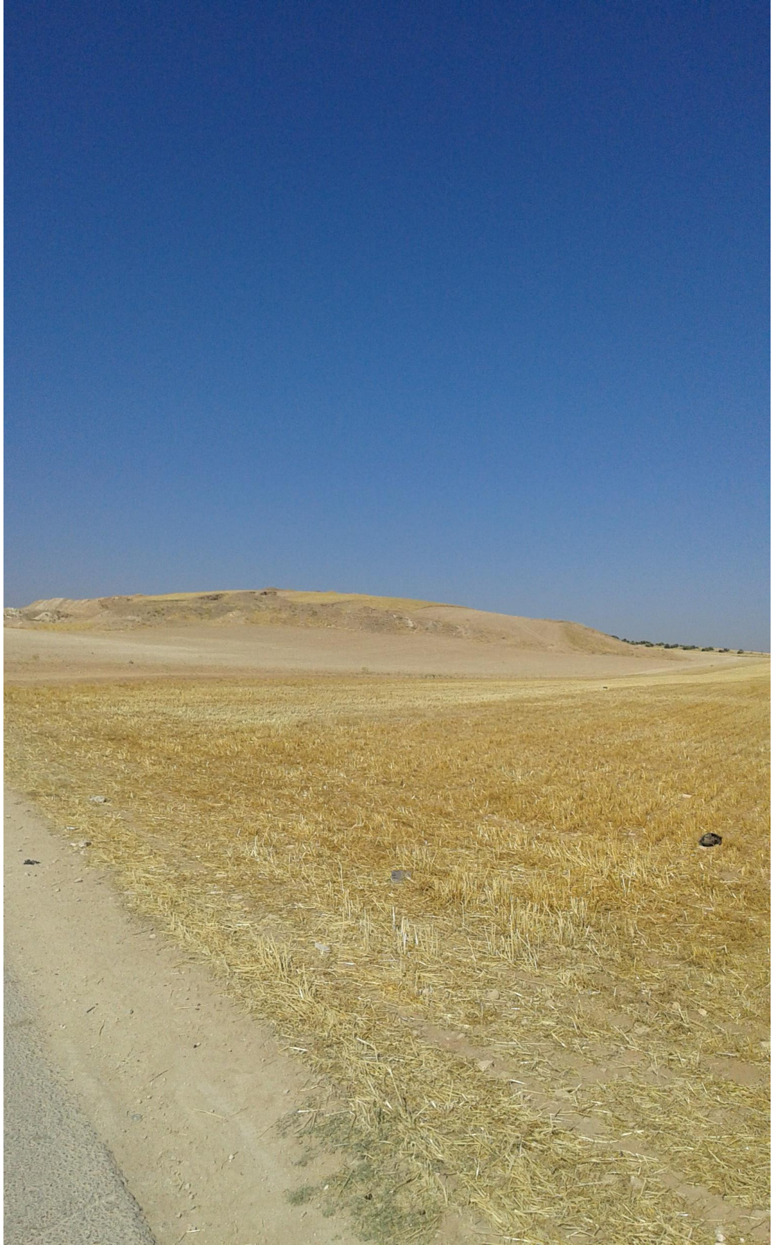
التل من الجهة الجنوبية الغربية تظهر اثار التنقيب والتجريف