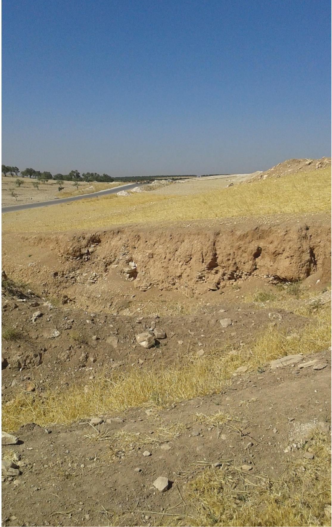
التل من الجهة الشمالية تظهر اثار التنقيب والجريف الغير شرعي