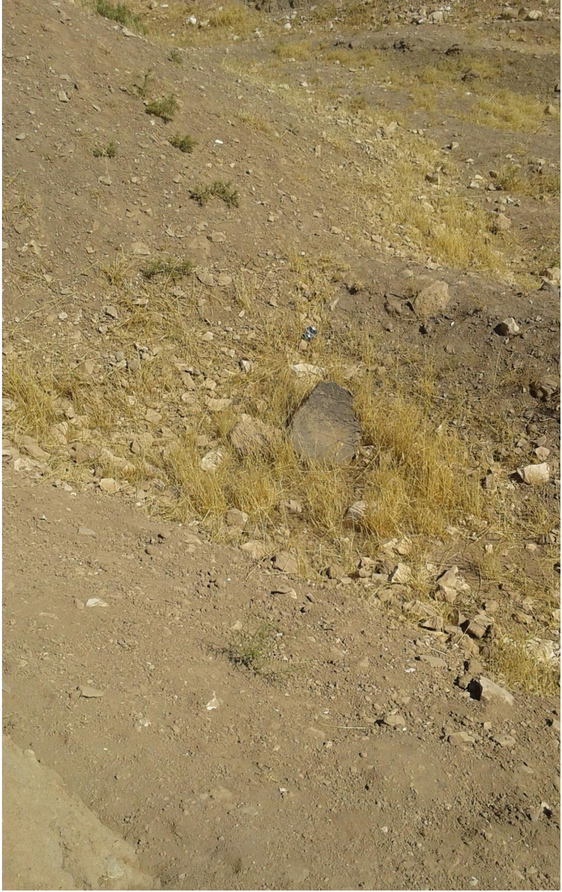
بعض اللقى الاثرية المهمة (حجر بازلتي)