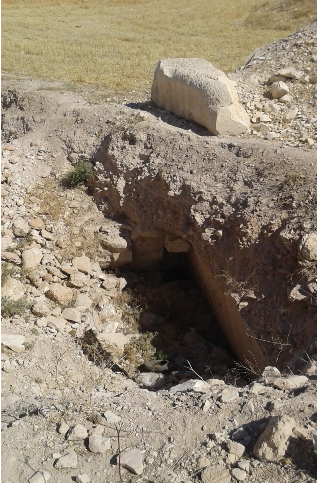
التل من الجهة شرقية تظهر اثار التنقيب والجريف الغير شرعي