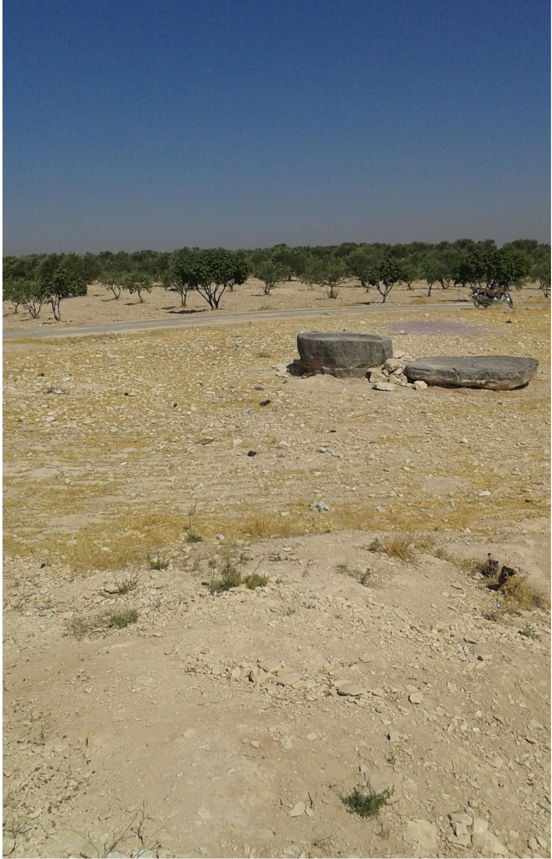
التل من الجهة شرقية بقايا معصرة قديمة