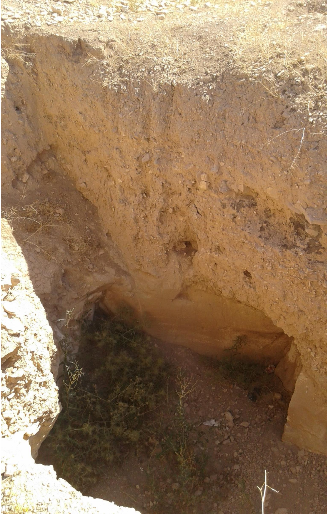
اثر التنقيب والجريف الغير شرعي من فترة سابقة