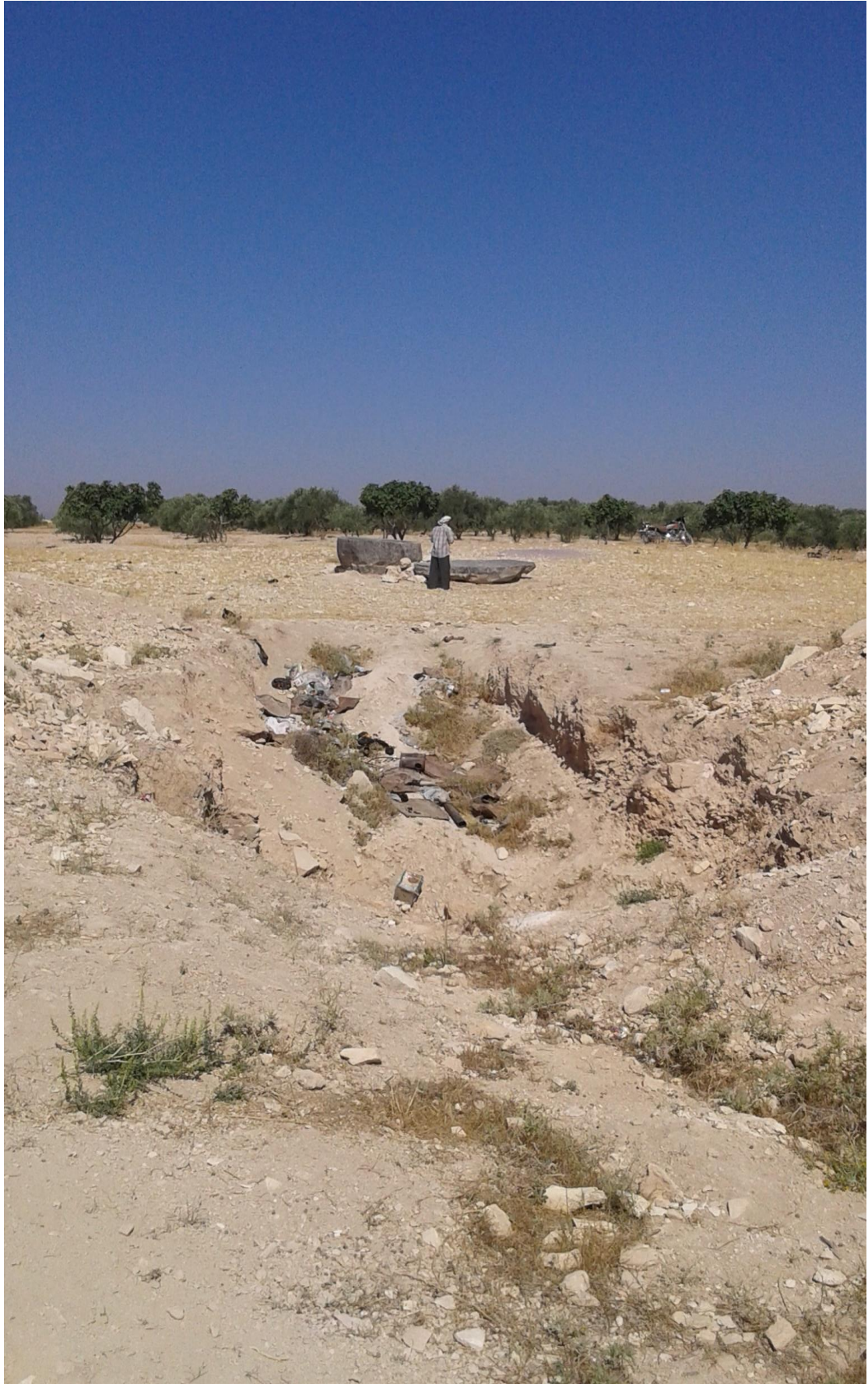
التل من الجهة شرقية تظهر اثار التتقيب والجريف الغير شرعي