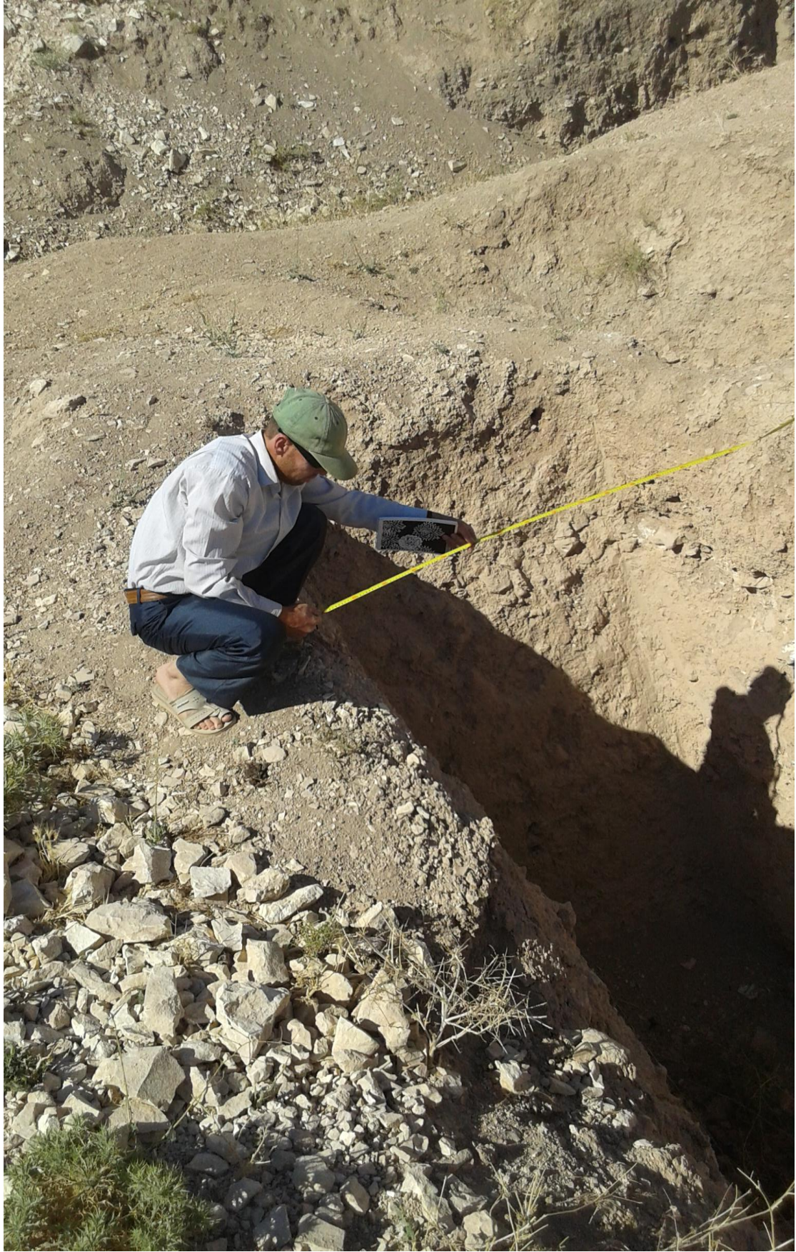
اثر التنقيب والجريف الغير شرعي ومحاولة الكشف على الاثار