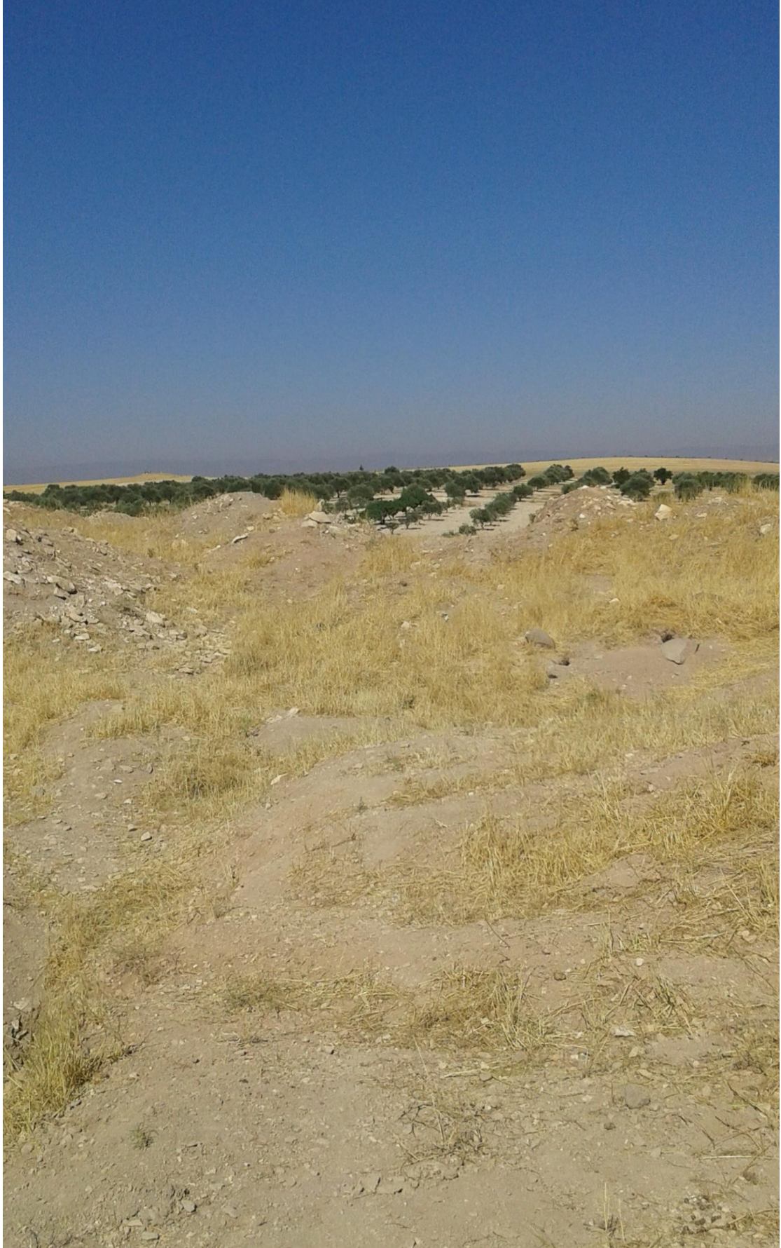
التل من الجهة شرقية من الاعلى تظهر اثار التنقيب والجريف الغير شرعي