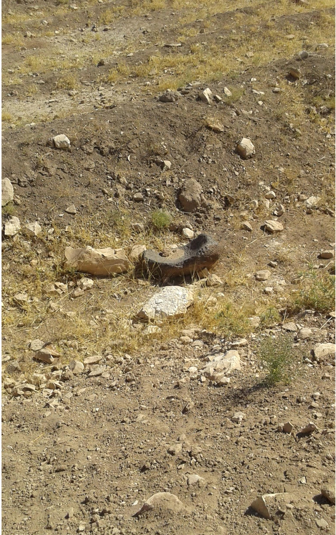
بعض اللقى الاثرية المهمة