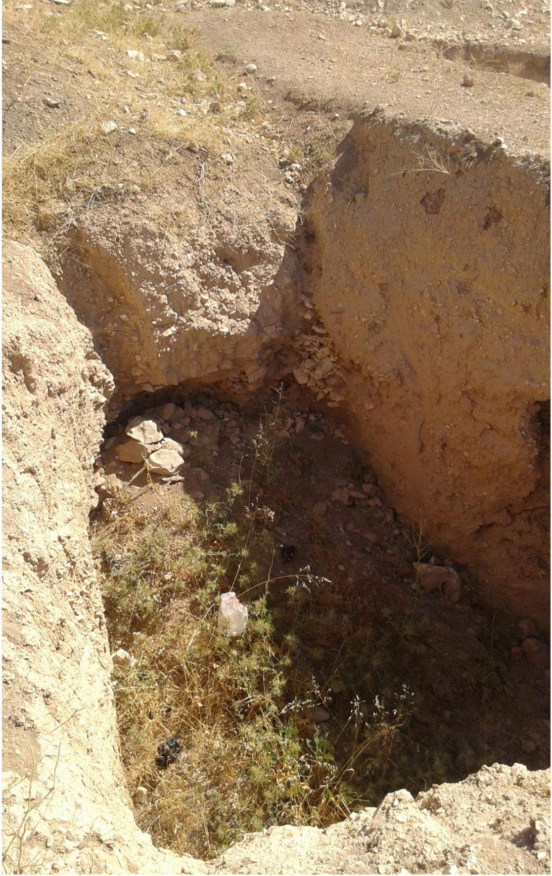
اثر التنقيب والجريف الغير شرعي من فترة سابقة