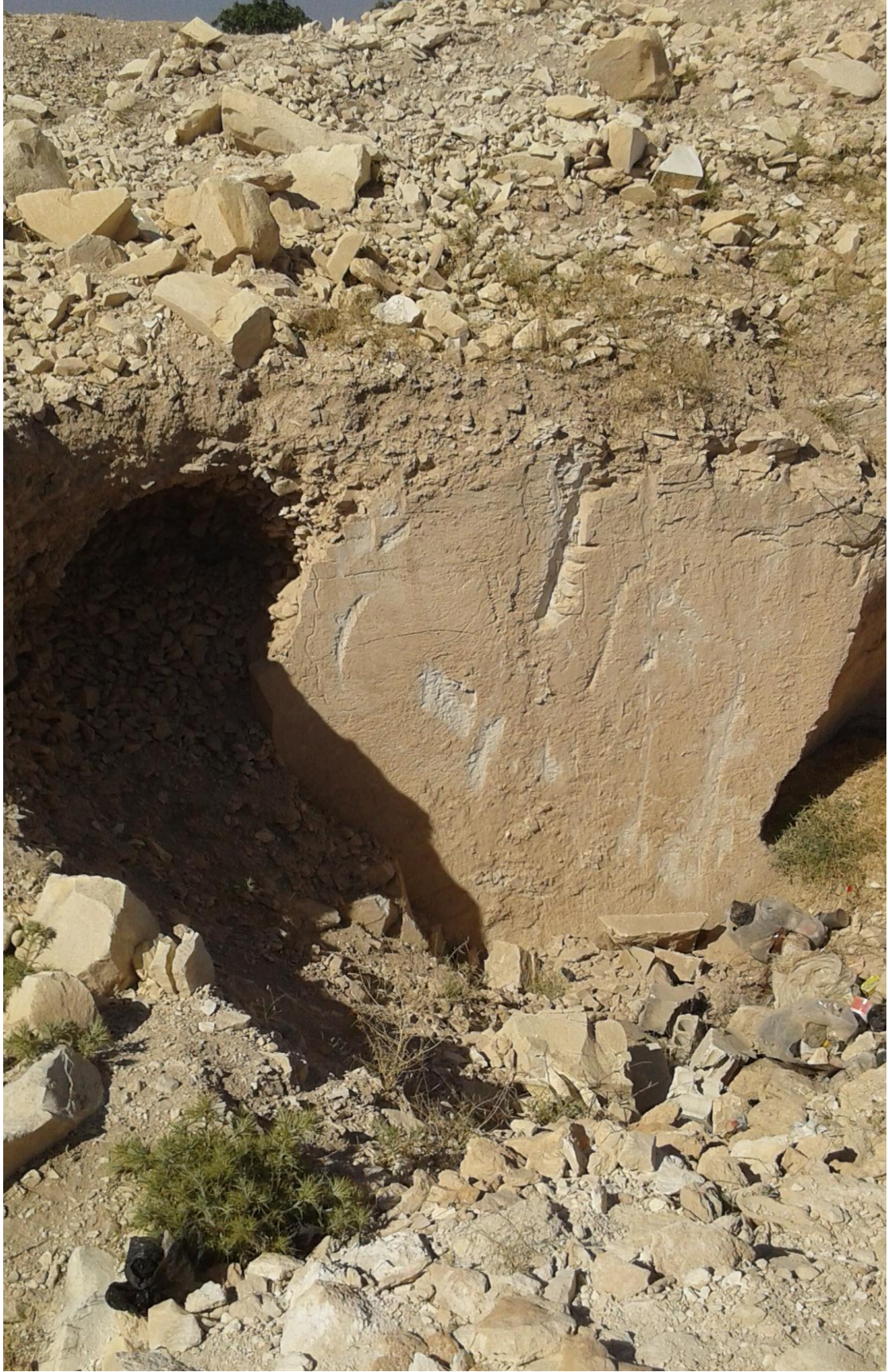
التل من الجهة شرقية تظهر اثار التنقيب والجريف الغير شرعي