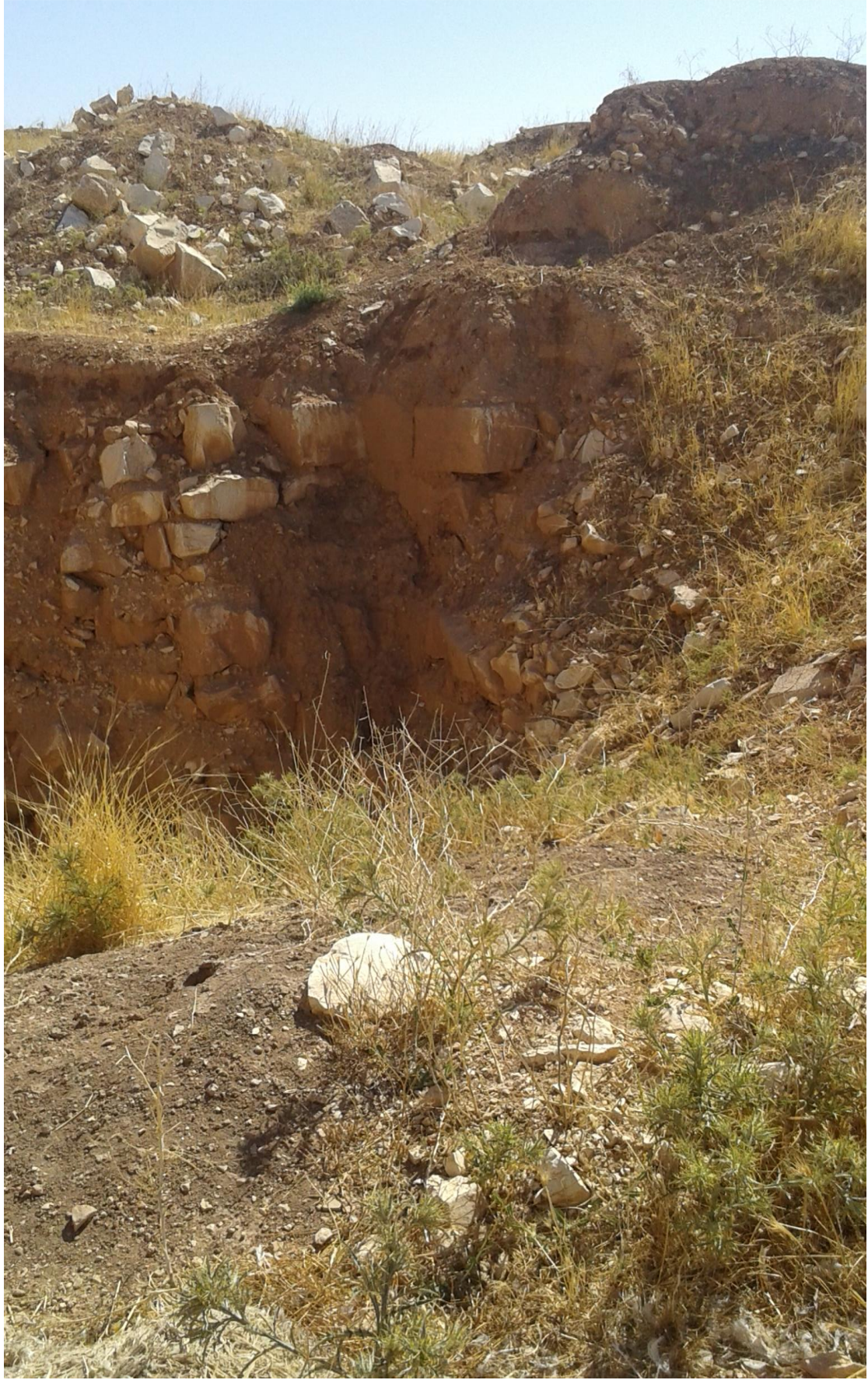
التل من الجهة شرقية تظهر اثار التنقيب والجريف الغير شرعي