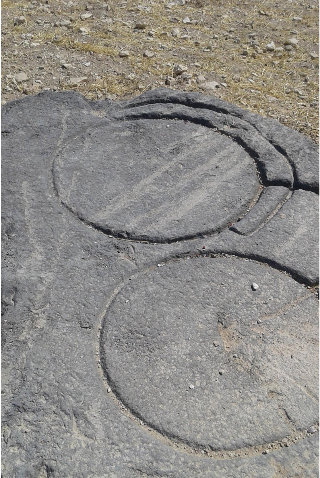
التل من الجهة شرقية بقايا معصرة قديمة