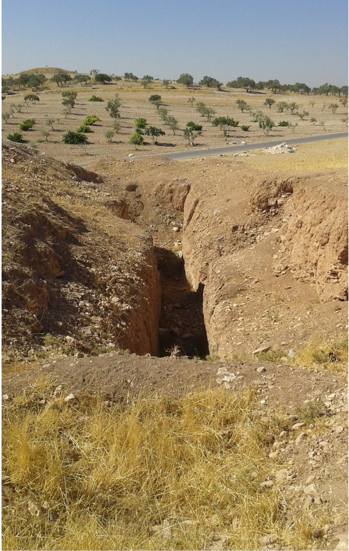
التل من الجهة الشمالية تظهر اثار التنقيب والجريف الغير شرعي