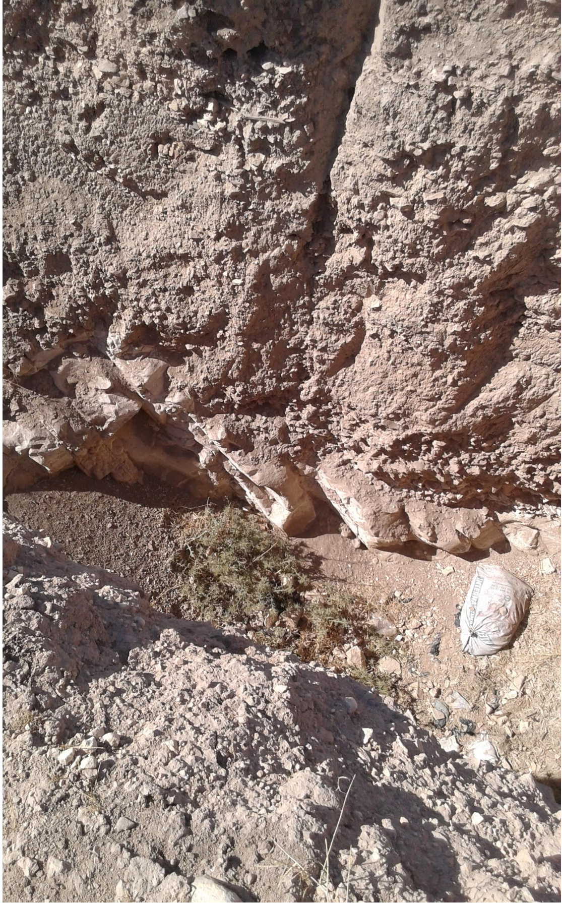
التل من الجهة الشمالية تظهر اثار التتقيب والجريف الغير شرعي