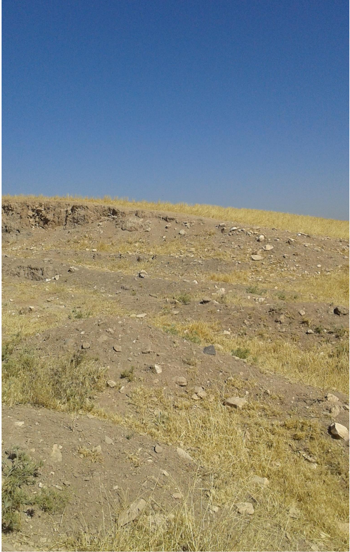
التل من الجهة الشمالية تظهر اثار التنقيب والجريف الغير شرعي