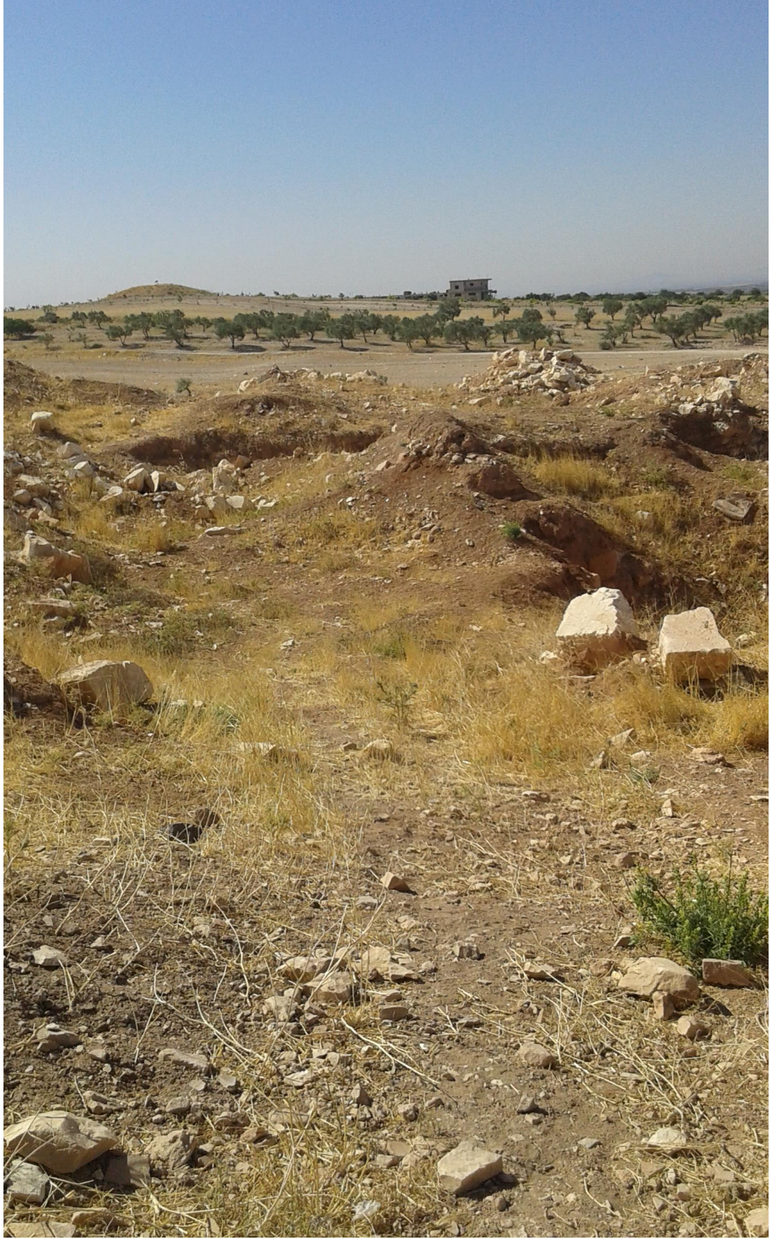
التل من الجهة شرقية تظهر اثار التنقيب والجريف الغير شرعي