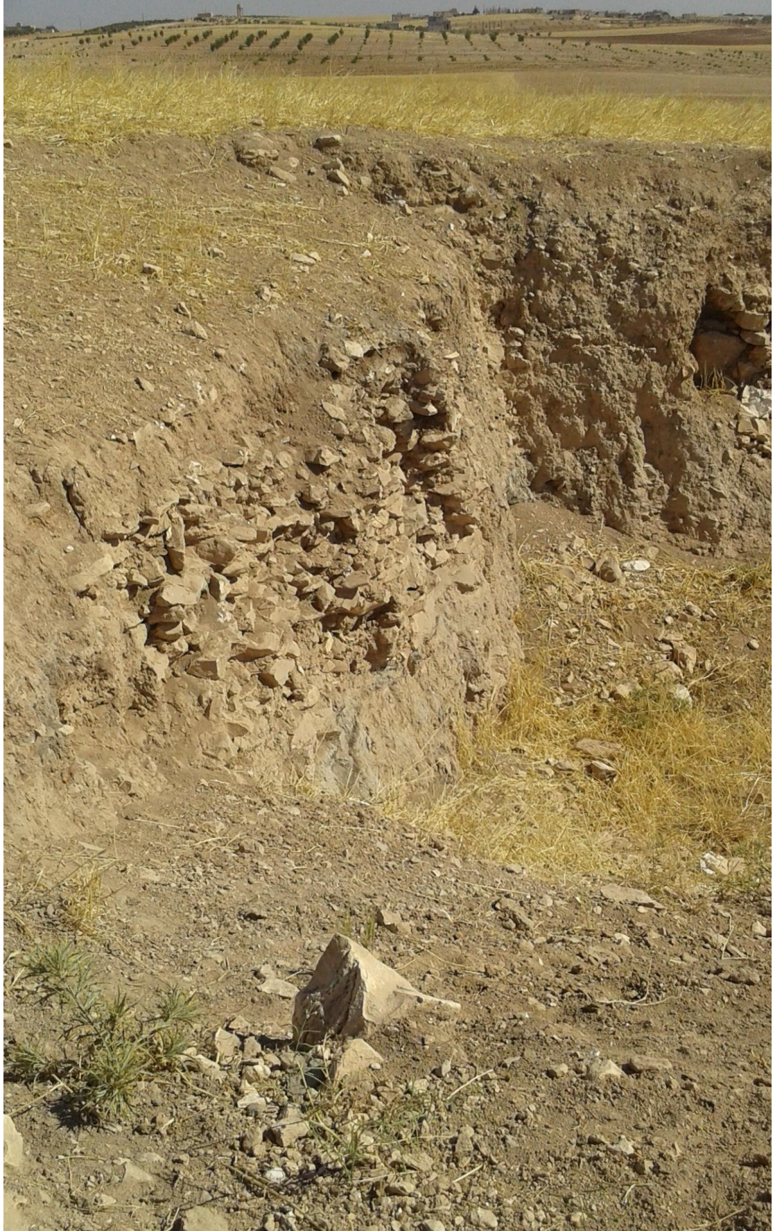
التل من الجهة الشمالية شرقية تظهر اثار التثقيب والجريف الغير شرعي