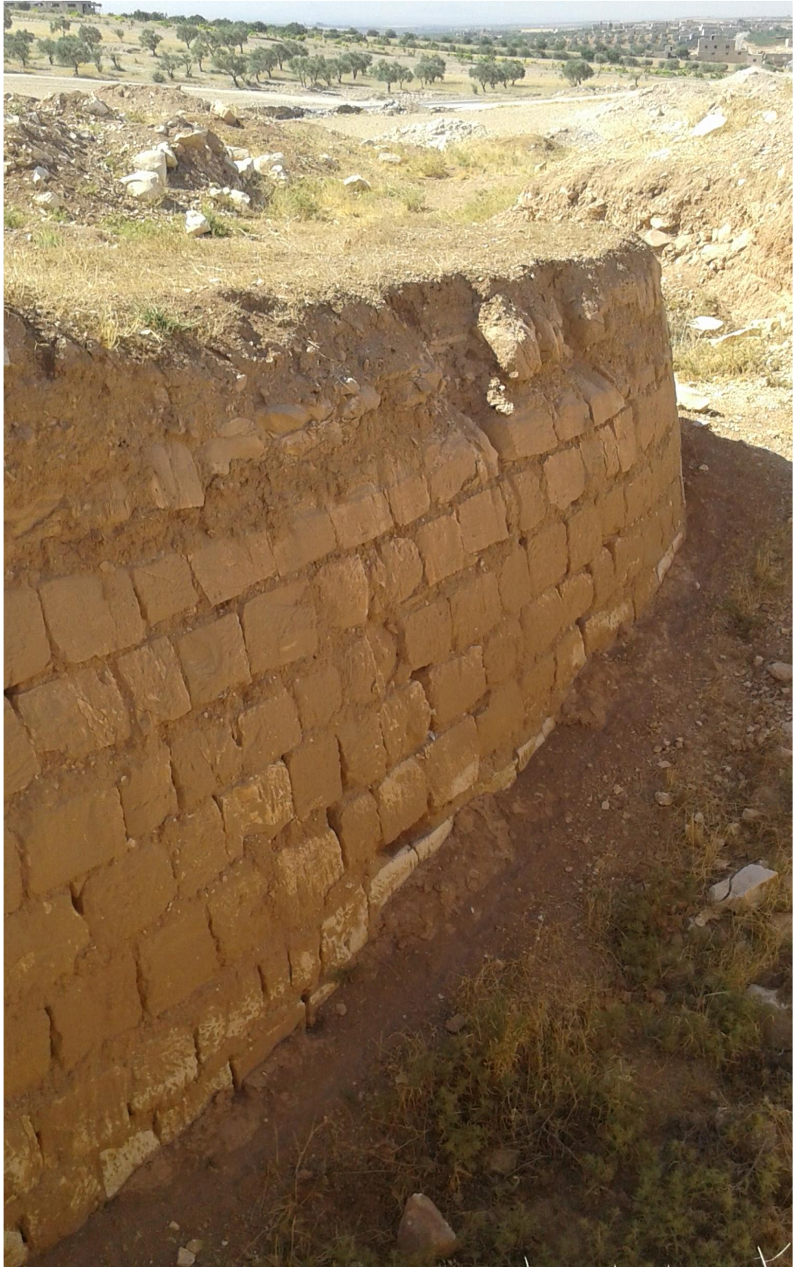
جدار ناتج عن اعمال التنقيب والجريف الغير شرعي