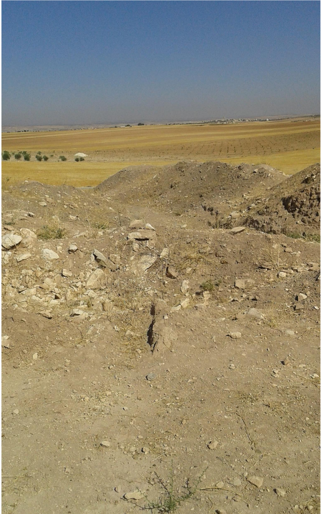
التل من الجهة الجنوبية شرقية تظهر اثار التنقيب والجريف الغير شرعي