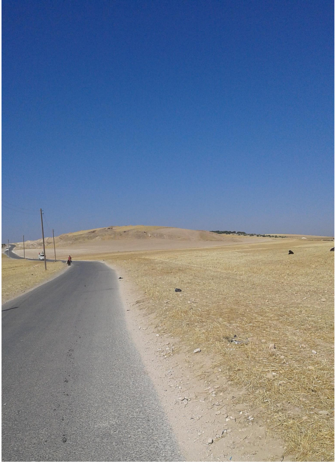
التل من الجهة الغربية حيث تظهر اثار التنقيب العشوائي والتجريف بالمعدات الثقيلة