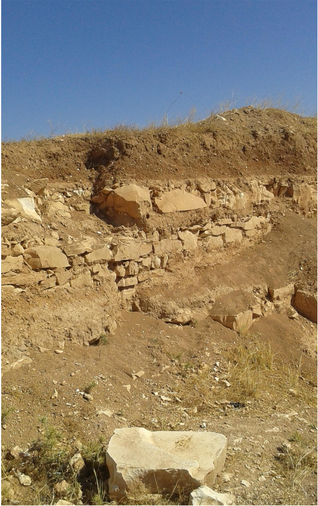
التل من الجهة شرقية تظهر اثار التنقيب والجريف الغير شرعي