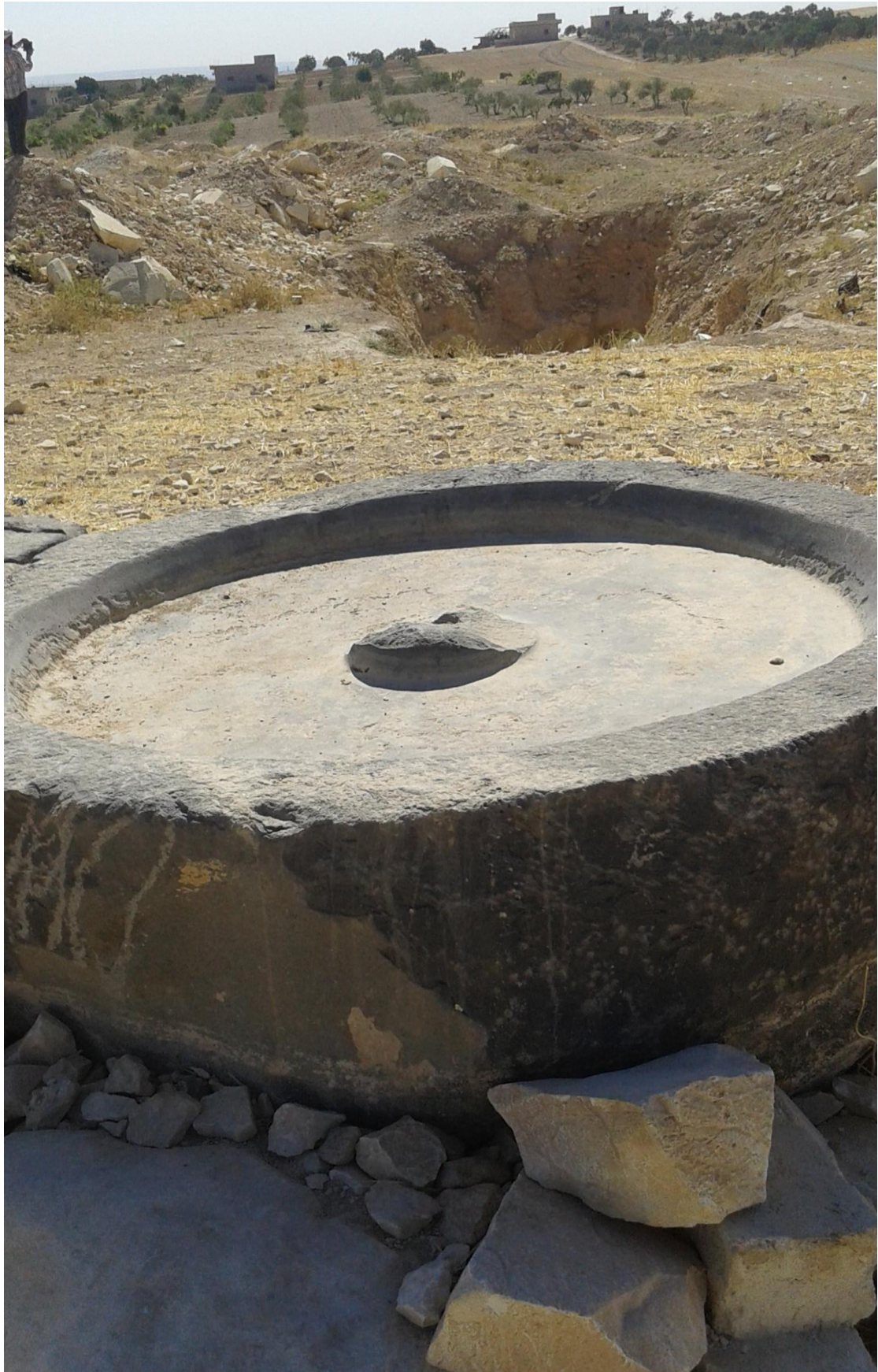
التل من الجهة شرقية بقايا معصرة قديمة