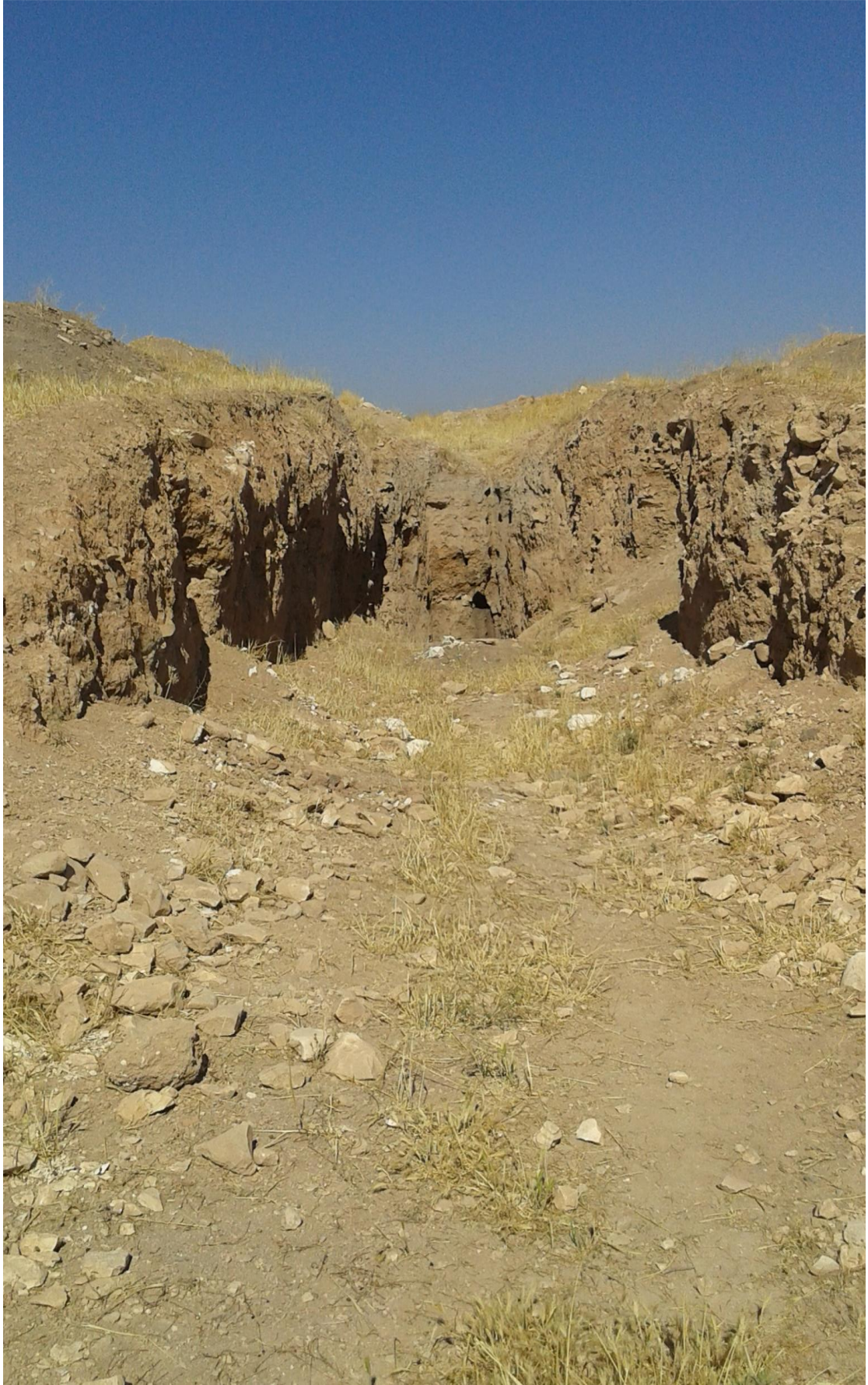
التل من الجهة الشمالية شرقية تظهر اثار التتقيب والجريف الغير شرعي