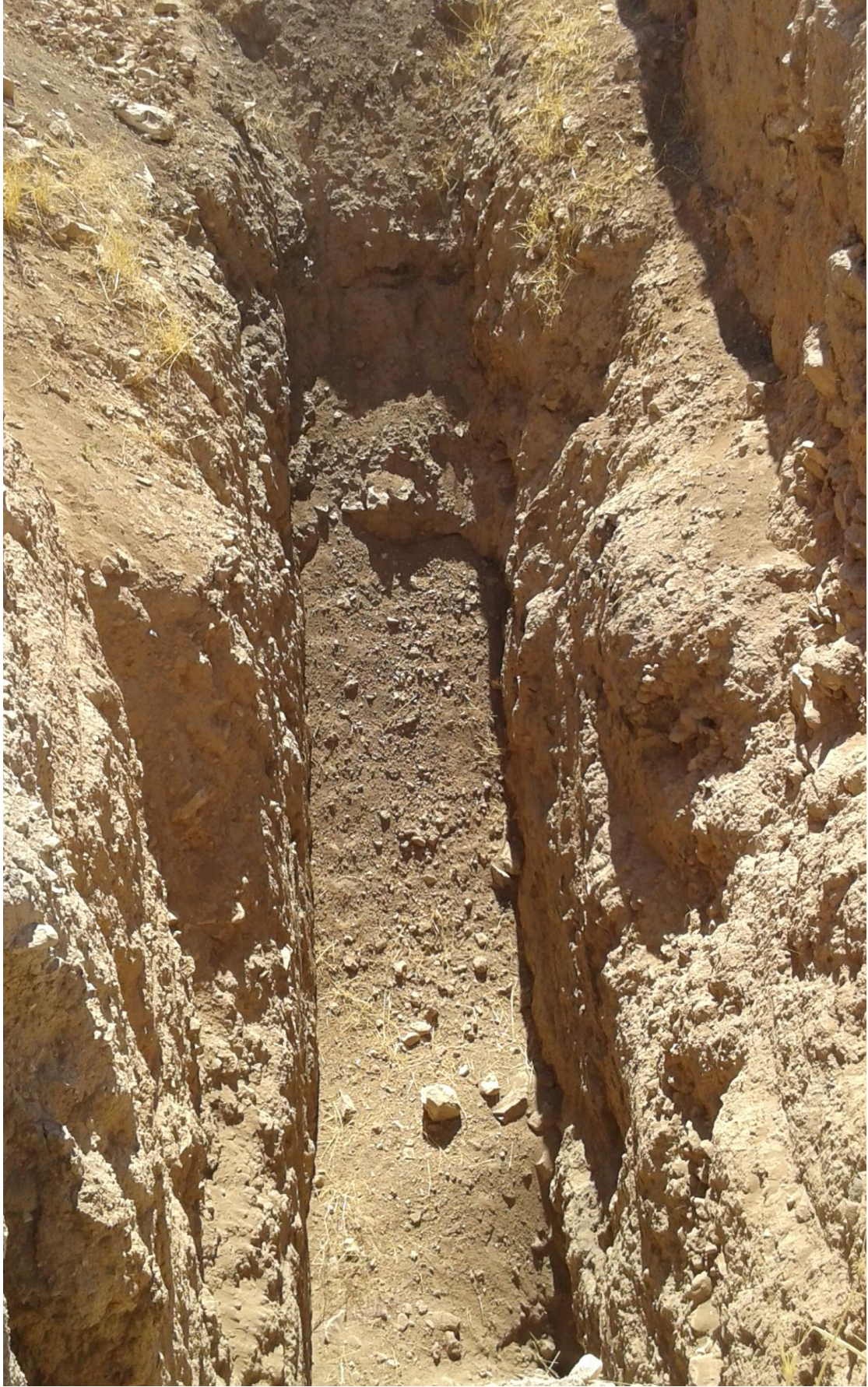
التل من الجهة الشمالية تظهر اثار التنقيب والجريف الغير شرعي