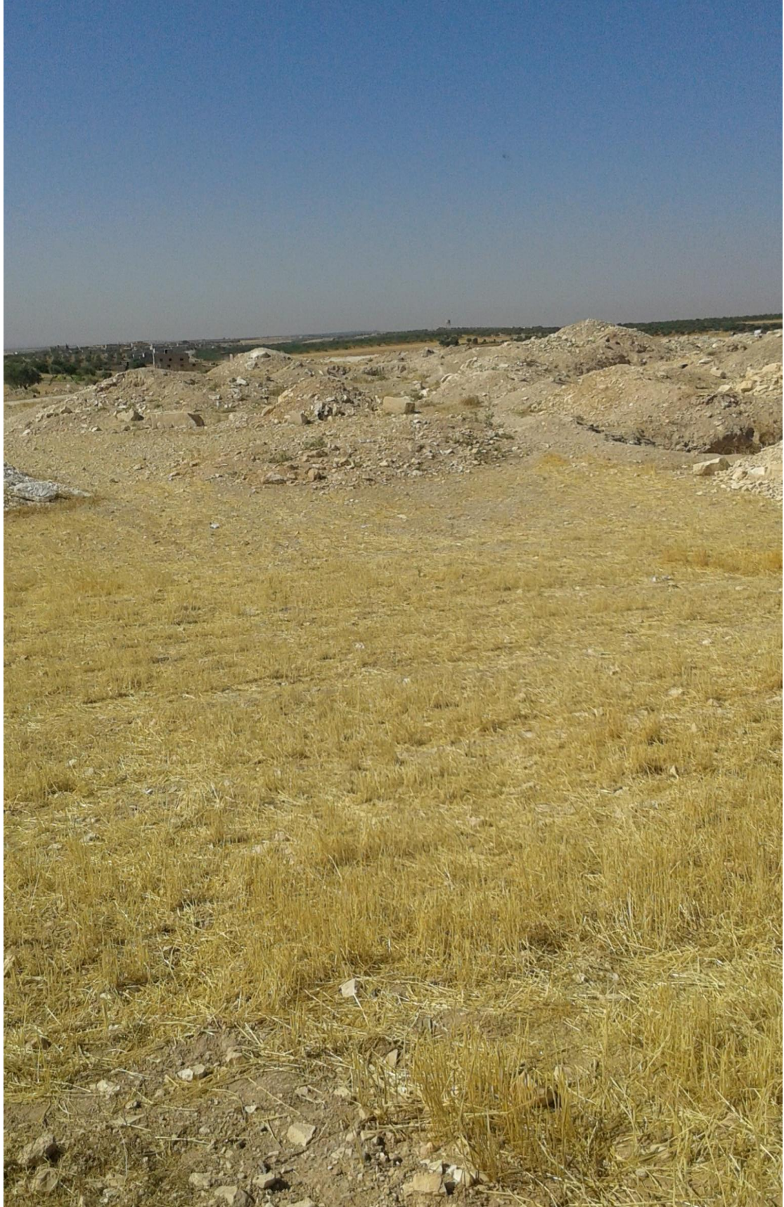
التل من الجهة شرقية تظهر اثار التقيب والجريف الغير شرعي