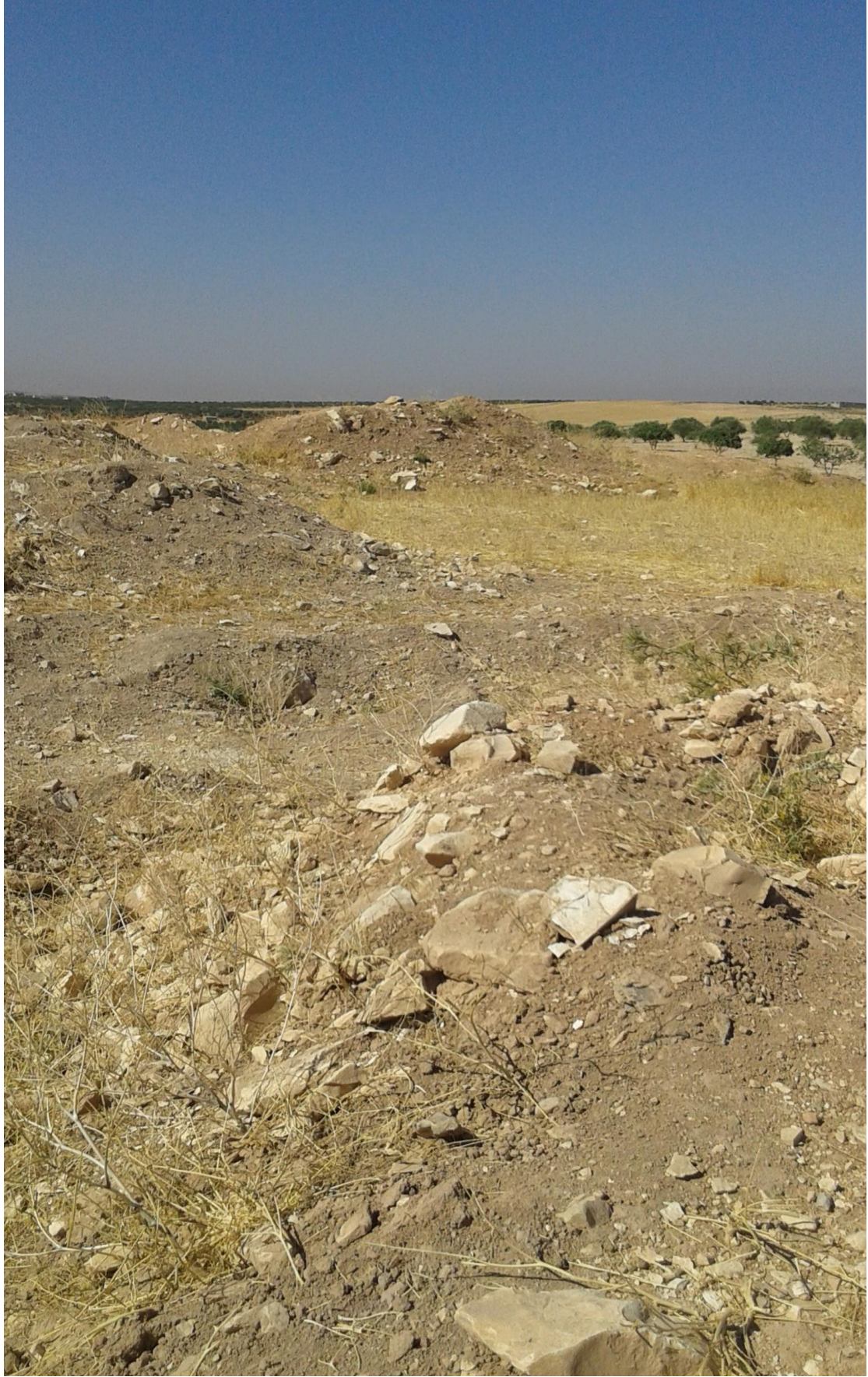
التل من الجهة الجنوبية تظهر اثار التنقيب الغير شرعي العشوائي