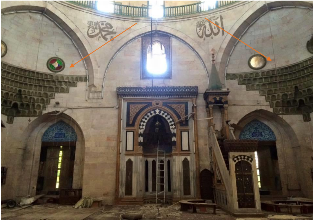
أضرار ضمن الساحة ناتجة عن برمبل متفجر أسقطه النظام السوري