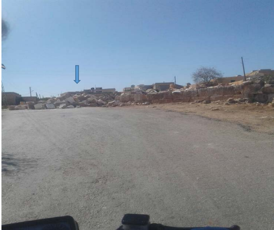
البناء بعد التدمير