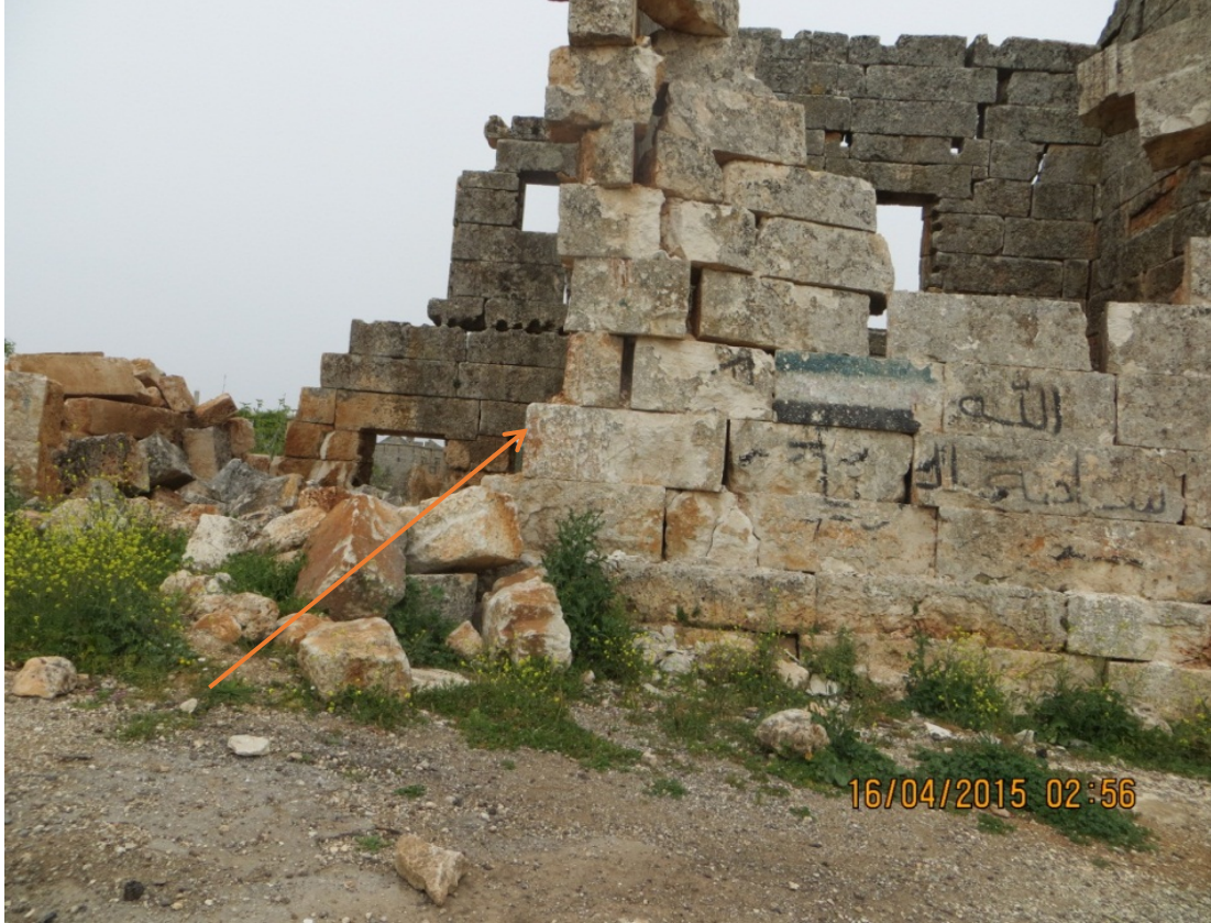
البناء الذي تم تدميره

وثق بجولة ميدانية لفريق المراقبين التابع لمركز حماية التراث الثقافي السوري بتاريخ 2015/4/16م