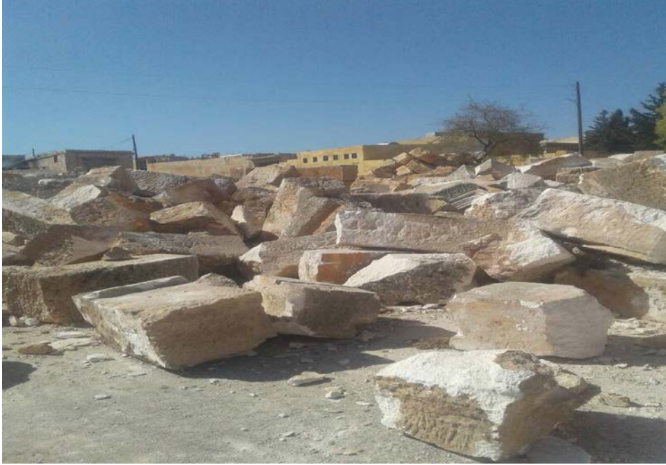
البناء بعد التدمير