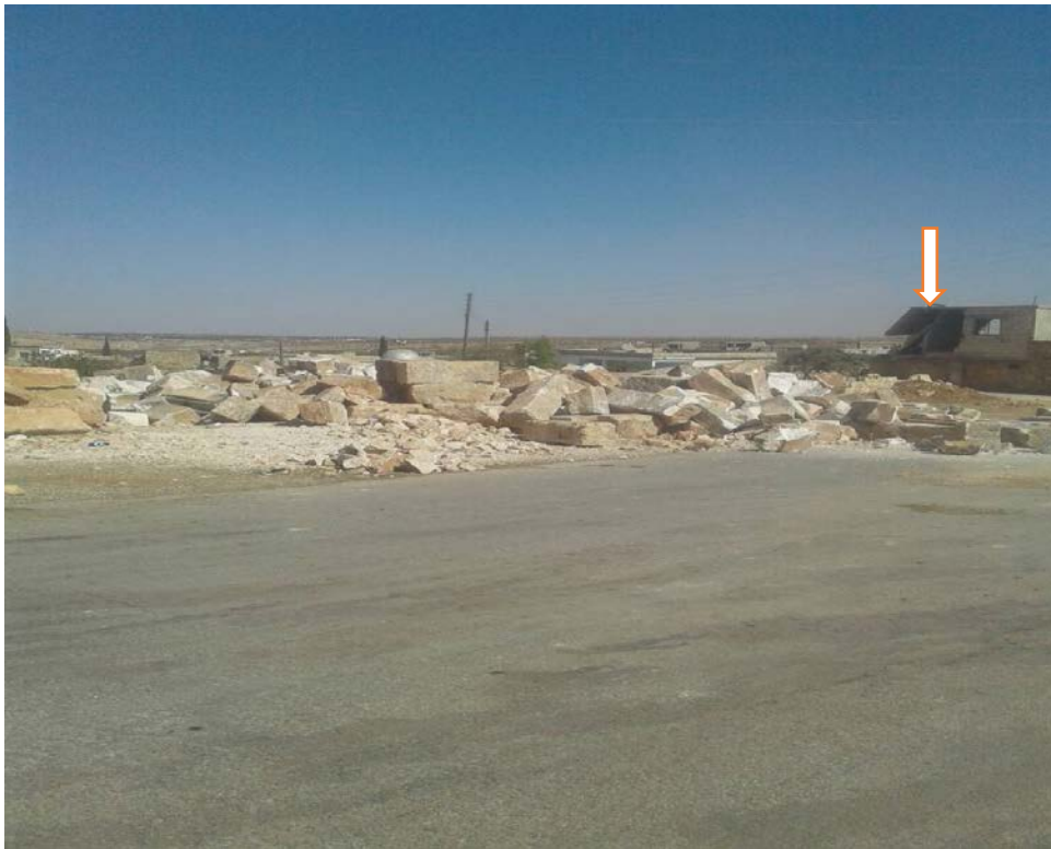
البناء الذي تم هدمه بشكل كامل