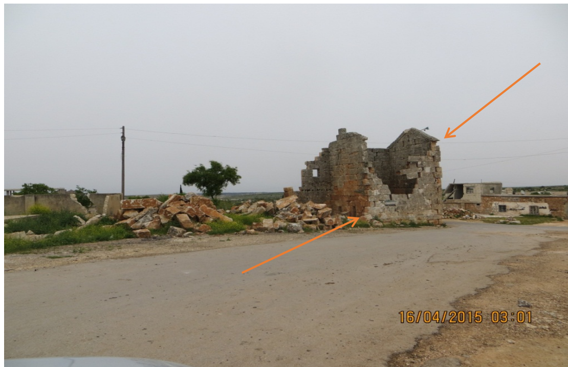
البناء قبل التدمير من الجهة الجنوبية الشرقية