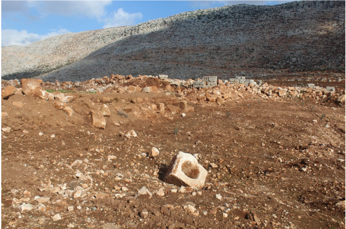
تنقيب باستخدام المعدات الثقيلة