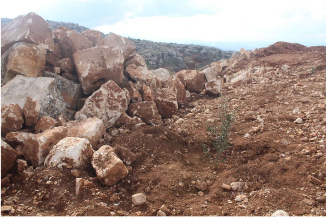
تنقيب باستخدام المعدات الثقيلة

أدت هذه العمليات الى اندثار الموقع بنسبة 90 بالمئة لدرجة لم يتبقى منه سوى جدار الكنسية في الطرف الجنوبي وبناءان في الطرف الغربي قام بتأهيلها سكان نازحون وسكنوا فيها.