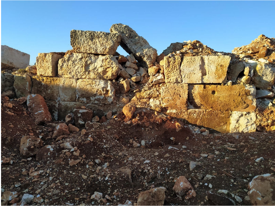
تنقيب باستخدام المعدات الثقيلة