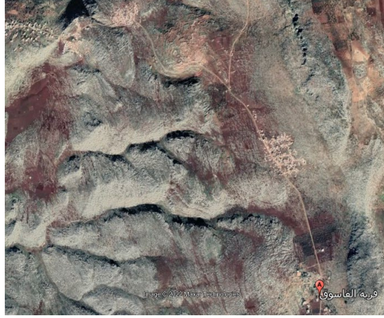
موقع كفر تعقاب او عقارب

يعود تاريخ بناء كفر تعقاب إلى الفترة الكلاسيكية التي تشمل العهدين البيزنطي والروماني، وهو من المواقع الأجل والأكثر عراقية وقدماً في المنطقة، التي تظهر مدى الحضارة والراقي العمراني الذي شهدته المنطقة في تلك الفترة، وفيه كنيسة تعود إلى القرن الخامس أو بداية القرن السادس، يتميز الموقع باتساعه وبأبنيته المتنوعة من كنائس وأديرة إلى جانب الدور السكنية، كما يوجد فيه العديد من المدافن والمغارات والمعاصر المحفورة بالصخر.