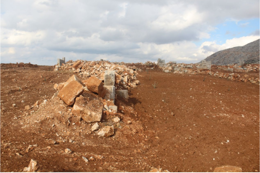
تنقيب باستخدام المعدات الثقيلة

بعد عملية التجريف قام بعض السكان بتأهيل الموقع ليصبح أرض زراعية مع ترحيل حجارة الأبنية بشكل كامل واستخدام باقي الحجارة في عملية تسوير الأرض بكل اسف وقد تم حفر آبار مياه ارتوازية في أماكن مختلفة من الموقع الذي أصبح أرض زراعية بامتياز.