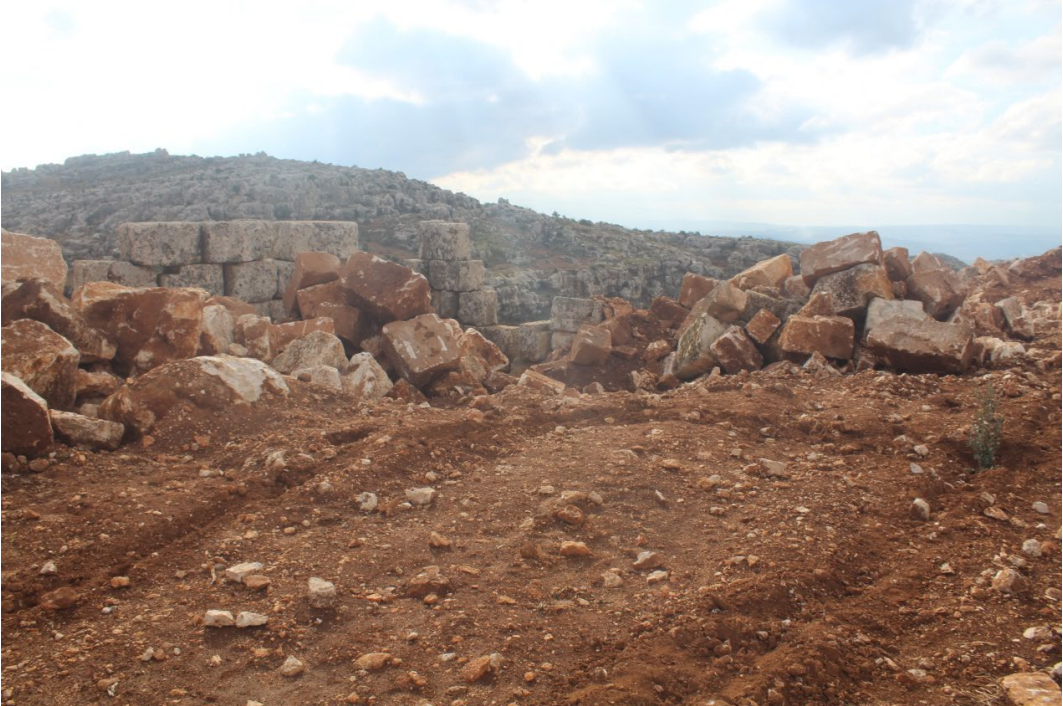
تنقيب باستخدام المعدات الثقيلة