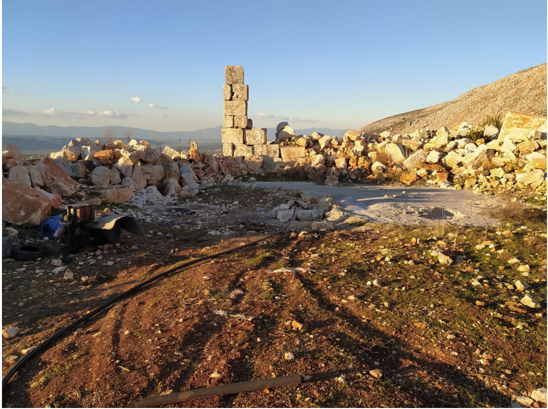
تنقيب باستخدام المعدات الثقيلة