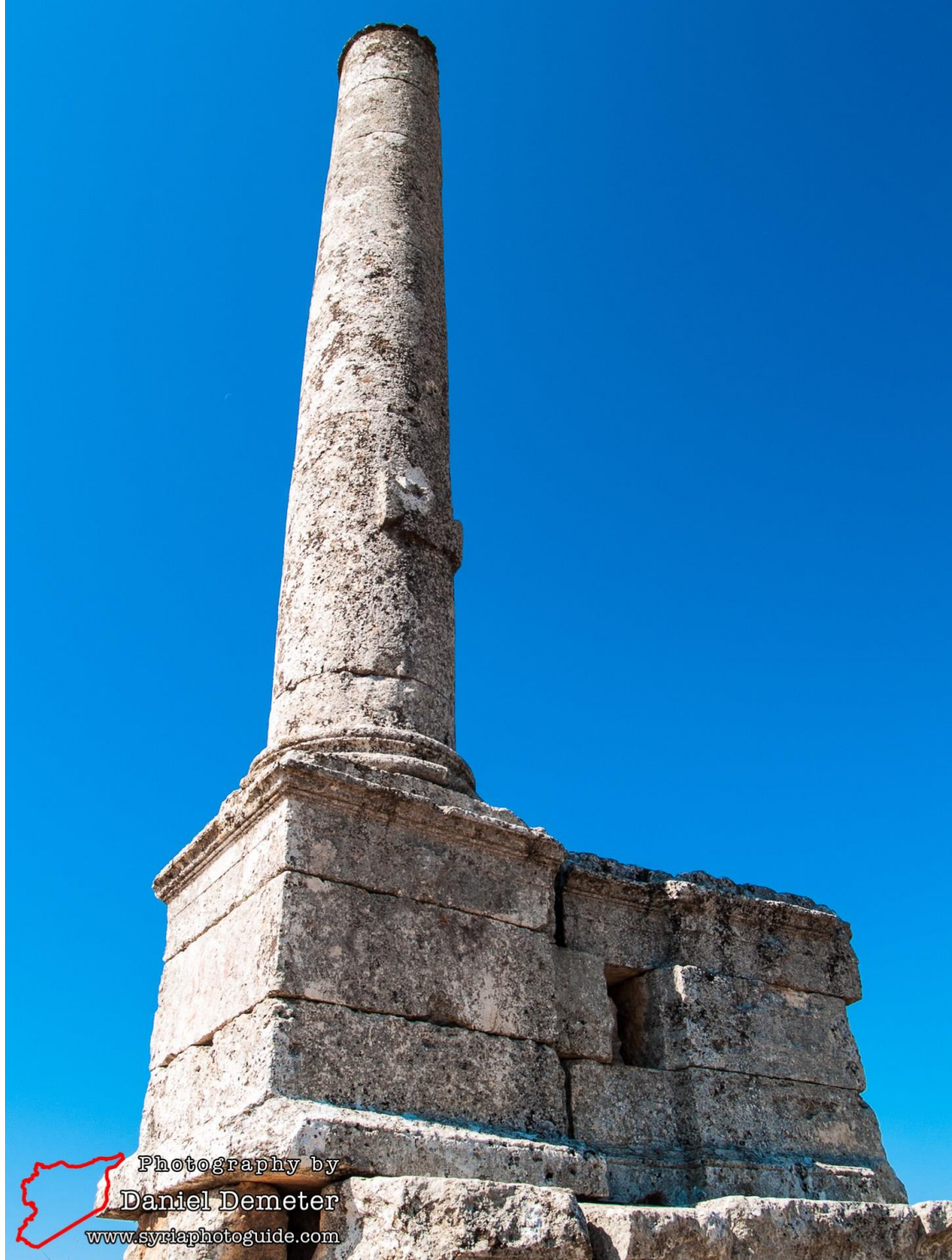
عمود بنابل قیل التدمير

مدعومة بفصيل عسكري بتجريف المكان بالمعدات الثقيلة و ذلك بهدف الحصول على اللقى الأثرية و ذلك لبيعها للصووص الأثار و بهدف الاتجار الخارجي