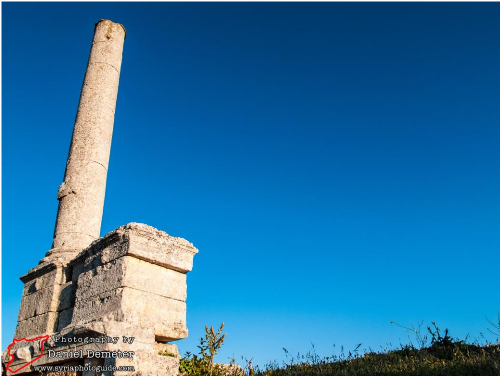
عمود بنابل قبل التدمير