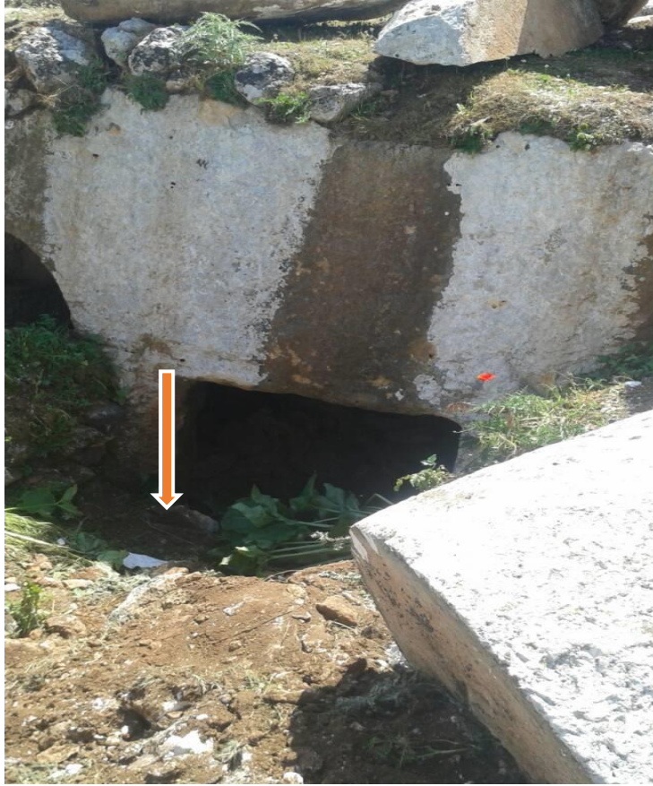
تنقيب غير شرعي