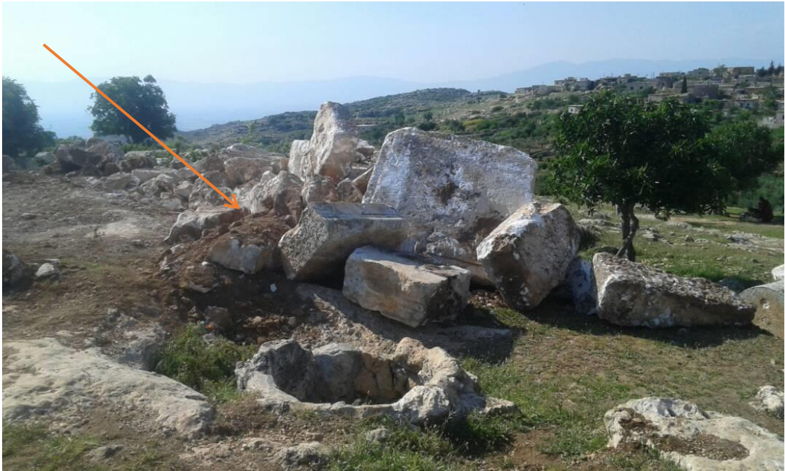
تجريف بالمعدات الثقيلة حيث يظهر تكسير وتدمير للبناء