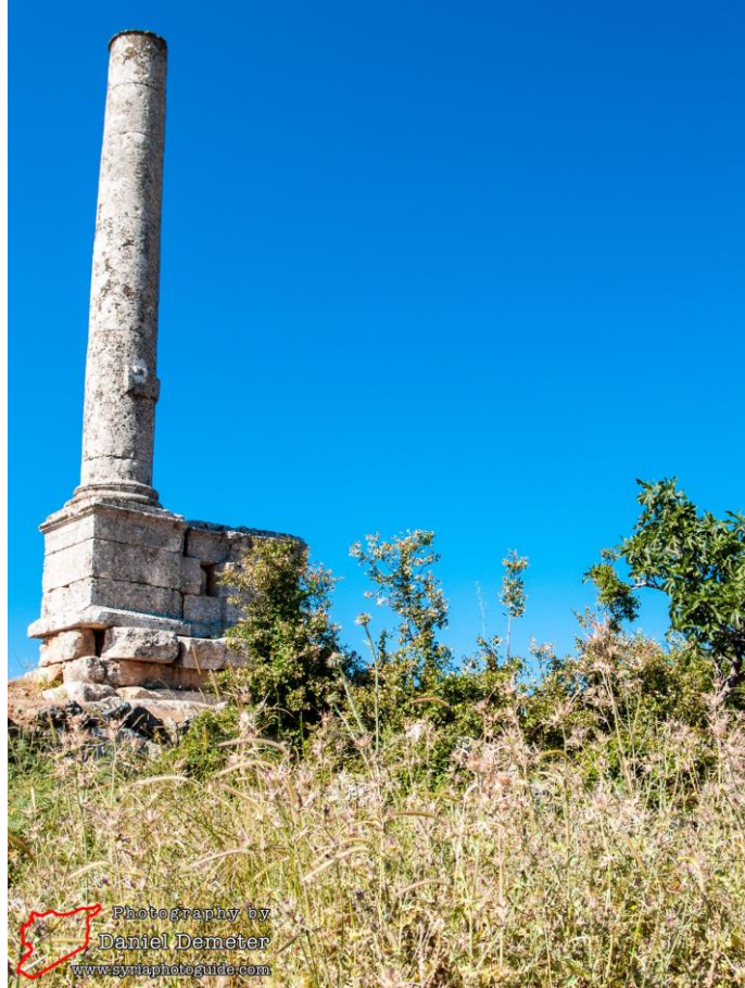
عمود بنابل قبل التدمير