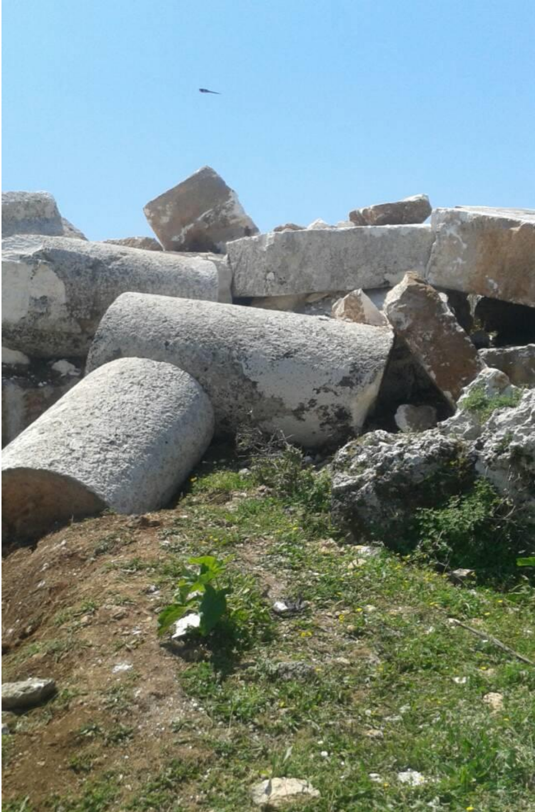
تكسير الاحجار بعد تجميعها