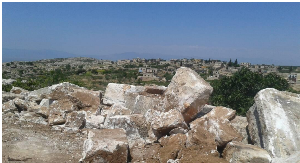
تكسير الاحجار بعد تجميعها