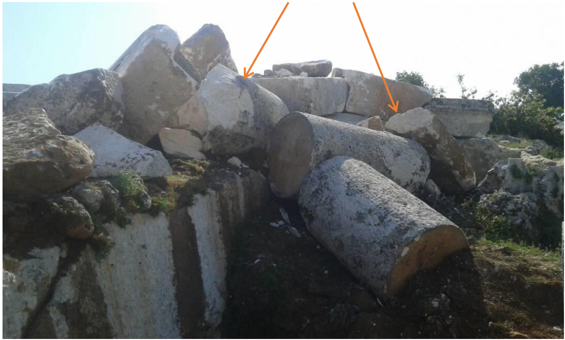
تكسير الاحجار بعد تجميعها الى طرف الموقع