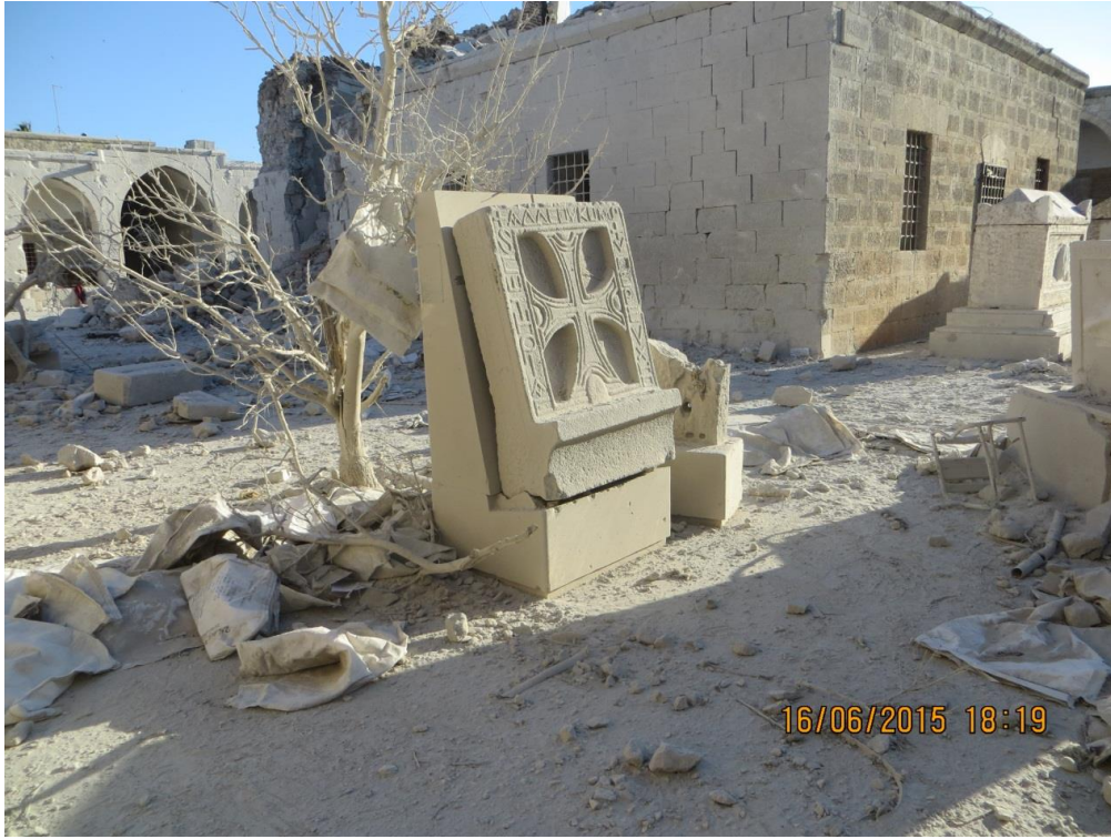
أكياس الرمل المتناثرة بفعل الانفجار.