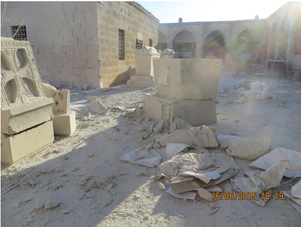
أكياس الرمل المتناثرة بفعل الانفجار.