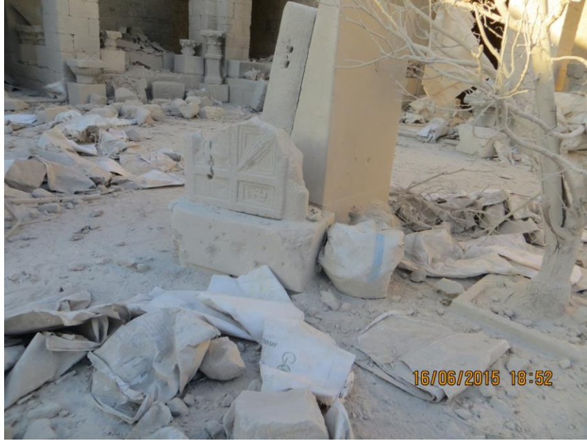
باب بازلي كسر بفعل التفجير.