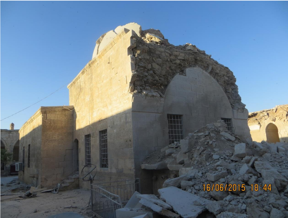
الزاوية الجنوبية الغربية من المسجد