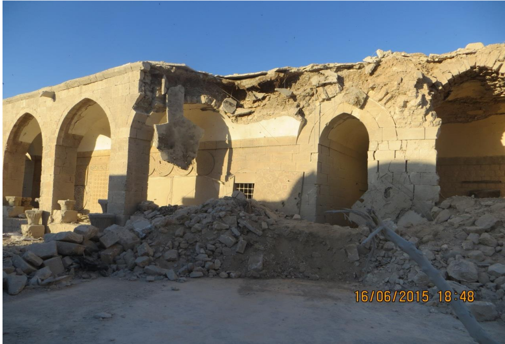
الواجهة الشرقية المتضررة بشكل كبير وتحتاج لإجراء إسعافي

تمثل بانهيار في البهو والجدار من الجهة الشرقية قابل للتوسع إذا لم يتم حل إسعافي لوقف عملية الانهيار وطال الانهيار غرفة كانت تستخدم كمكتب للعاملين، إن لم يتم إجراء حل إسعافي وعاجل سوف يطل الانهيار سقف الجناح الاول، كون البناء عقد فإن انهيار في أي من أحجار العقد سوف يؤدي لانهيار كبير، لذلك من الضروري وقف اي عملية انهيار في العقد.