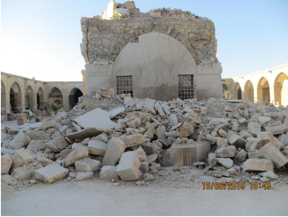
الجهة الجنوبية من المسجد