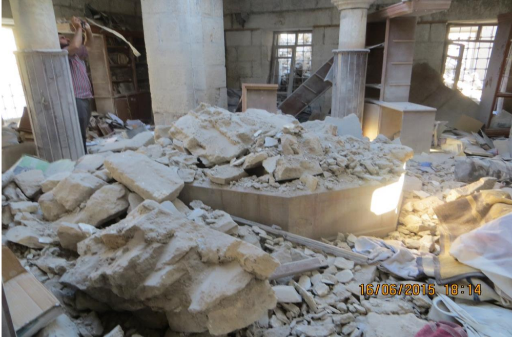
انهيار جزئي في بهو الجناح الاول والثاني وغرفة كانت تستخدم كمكتب:

تمثل بانهيار في البهو والجدار من الجهة الشرقية قابل للتوسع إذا لم يتم حل إسعافي لوقف عملية الانهيار وطال الانهيار غرفة كانت تستخدم كمكتب للعاملين، إن لم يتم إجراء حل إسعافي وعاجل سوف يطل الانهيار سقف الجناح الاول، كون البناء عقد فإن انهيار في أي من أحجار العقد سوف يؤدي لانهيار كبير، لذلك من الضروري وقف اي عملية انهيار في العقد.