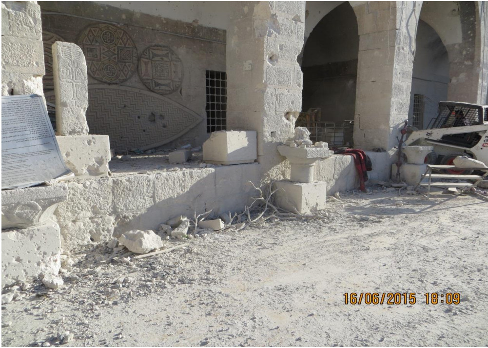
أضرار كبيرة طالت القطع الأثرية المعروضة