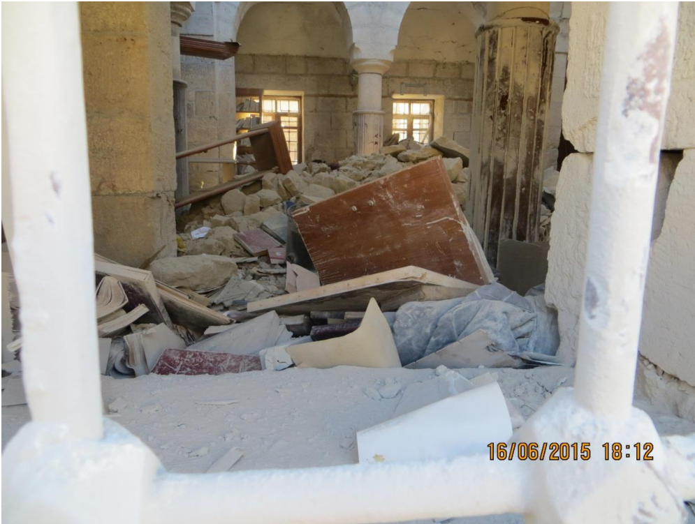
كتب ومخطوطات داخل التكية