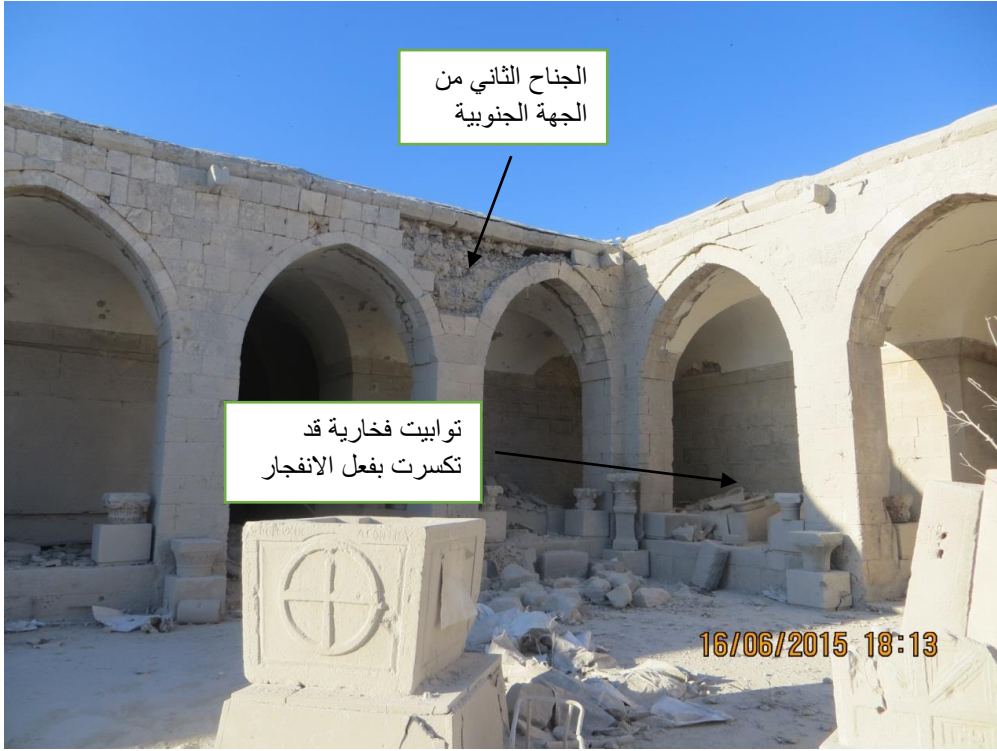
الجناح الثاني من الجهة الجنوبية

أضرار عظيمة لحقت بالمبنى تتمثل بشقوق وتكسر في الجدران نتيجة الضغط المرتفع الذي تعرضت له، وهناك حاجة ملحة لوقف انتشار الأضرار.