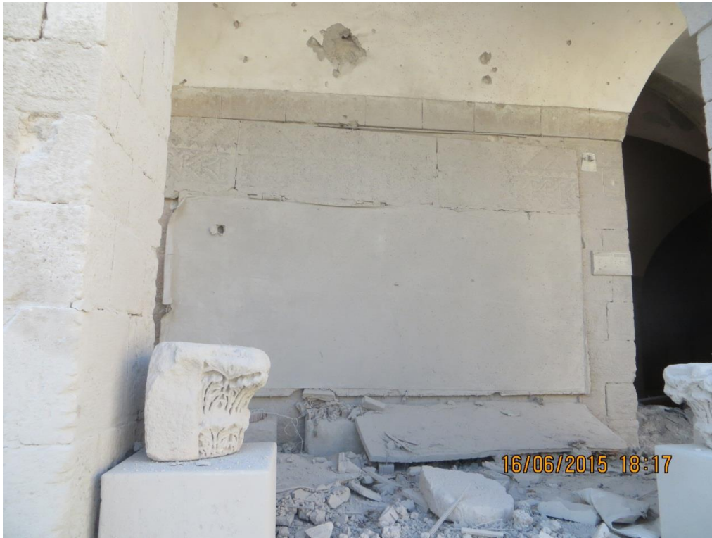
لوحة مغطاة بطبقة من الغرا والقماش بعد سقوط أكياس الرمل.