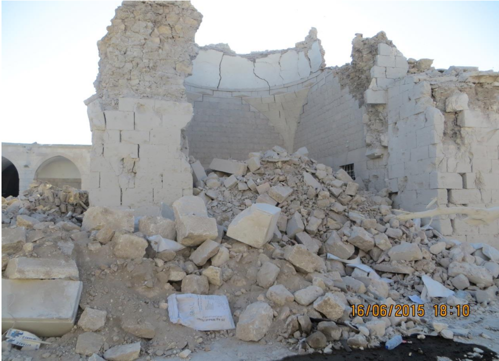
الجهه الشرقية من المسجد

تمثل بانهييار السقف والواجهه الشرقية بشكل كامل والواجهه الجنوبية بشكل جزئي