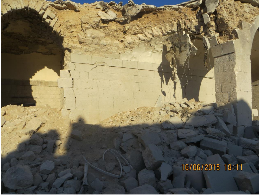
الواجهة الشرقية المتضررة بشكل كبير وتحتاج لإجراء إسعافي