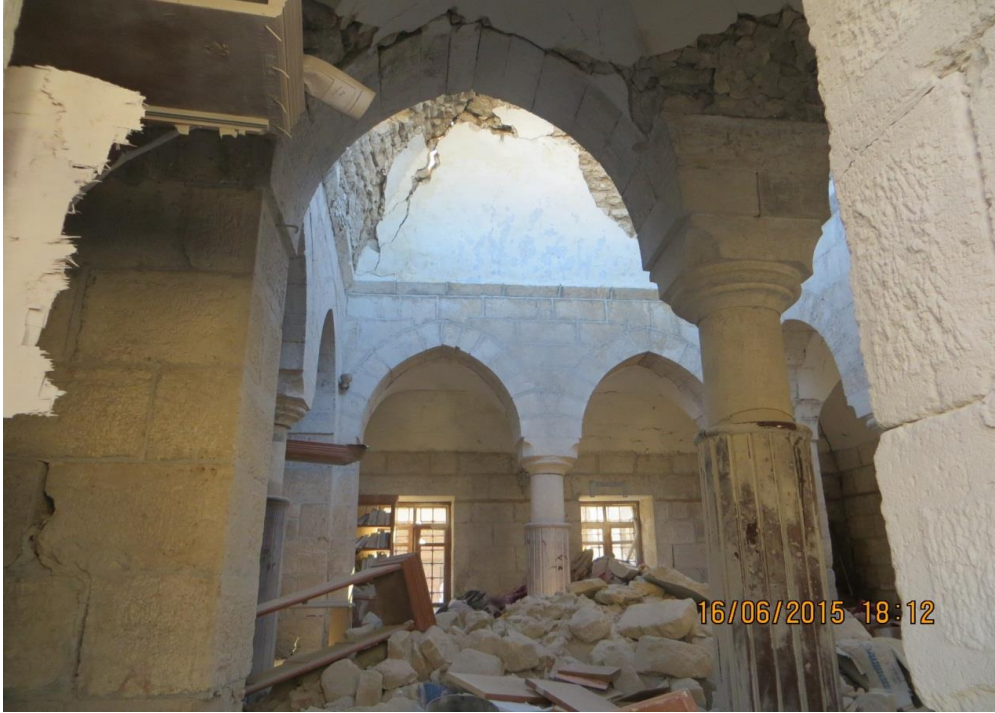
تمثل بانتهيار السقف بشكل كامل وأضرار كبيرة في الجدران، علماً ان التكية تحوي المكتبة العلانية