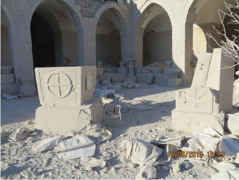
أكياس الرمل المتناثرة بفعل الانفجار.