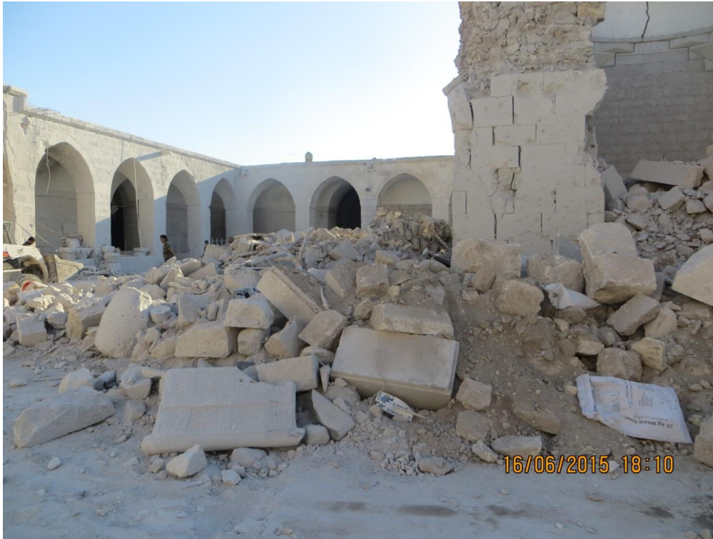
قطع أثرية بين الركام