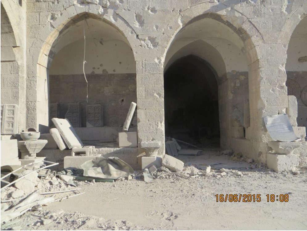
مدخل الجناح الأول مع الاضرار الحاصلة على الواجهة