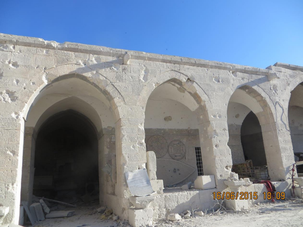
مدخل الجناح الاول