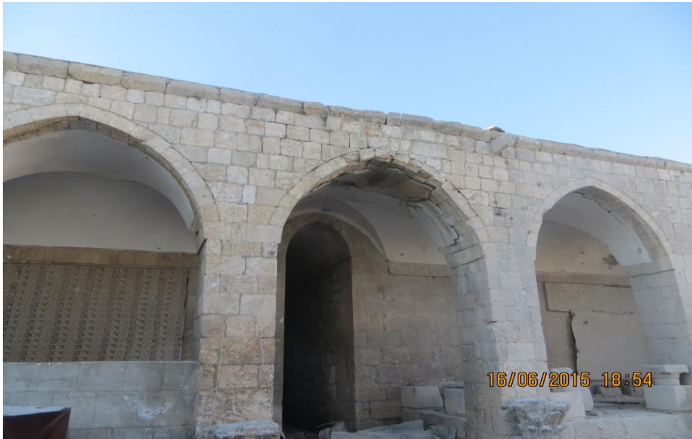
الواجهة التي تم ترميمها سابقا

أضرار عظيمة لحقت بالمبنى تتمثل بشقوق وتكسر في الجدران نتيجة الضغط المرتفع الذي تعرضت له، وهناك حاجة ملحة لوقف انتشار الأضرار.