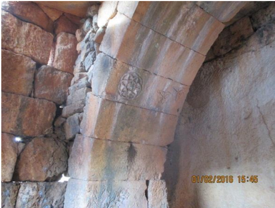
ساكف مميز منقوش بالكتلة الصخرية