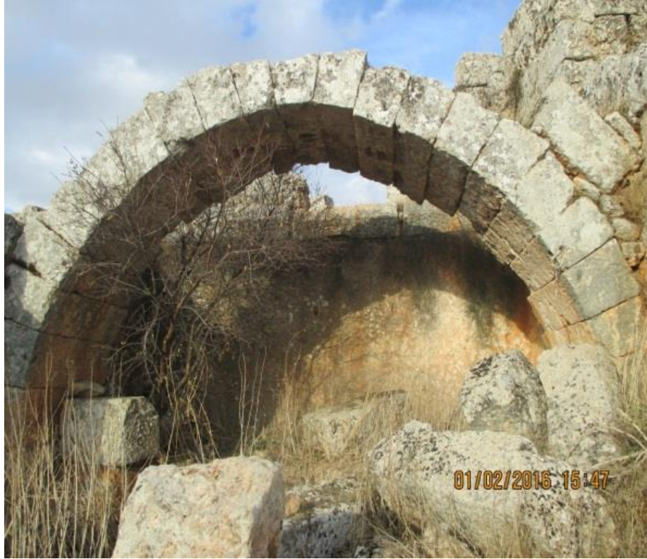
آثار الدمار الذي خلفته الغارة الجوية الروسية على الموقع: