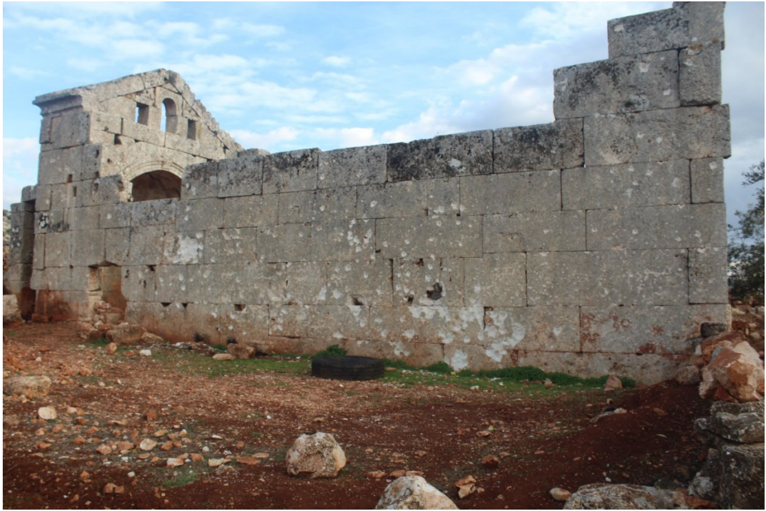
تخريب بفعل الطلق الناري