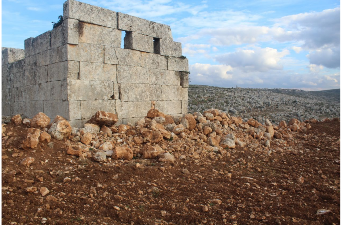
تجريف لاستصلاح الأراضي و زراعة الأشجار