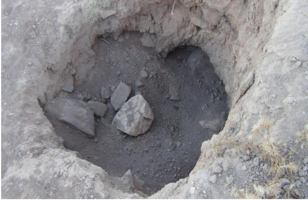
طبقة الفحم ظاهرة بشكل واضح في هذا المقطع.