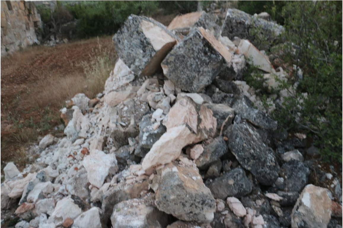
اضرار قصف الطيران الحربي على الكنيسة