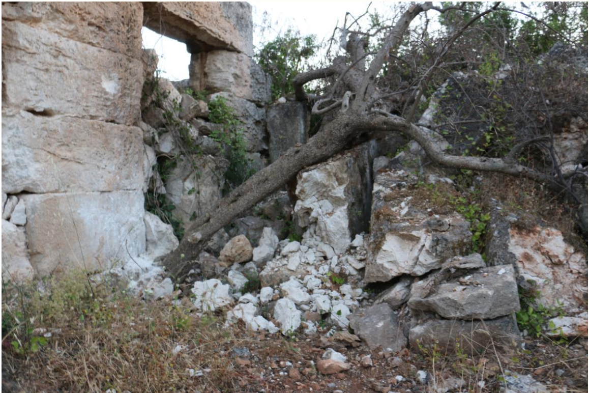
اضرار قصف الطيران الحربي على الكنيسة