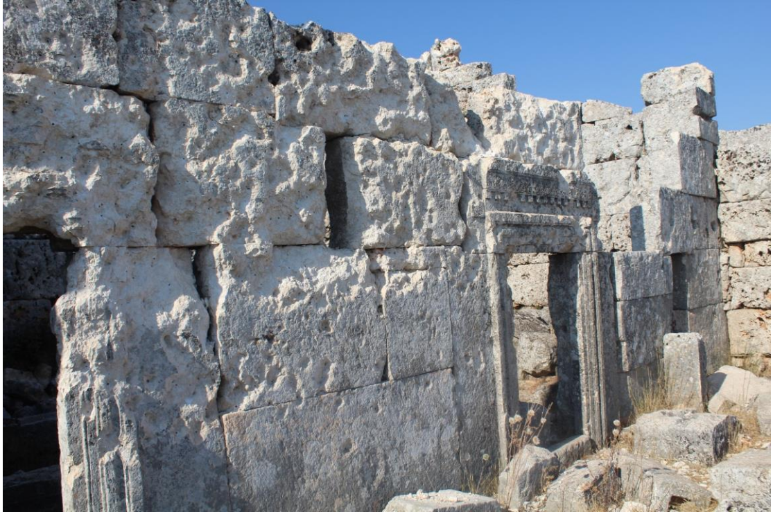
تعرض جدران هذا البناء لضرر كبير في احدى فترات الصراع (آثار الرصاص واضحة التأثير)