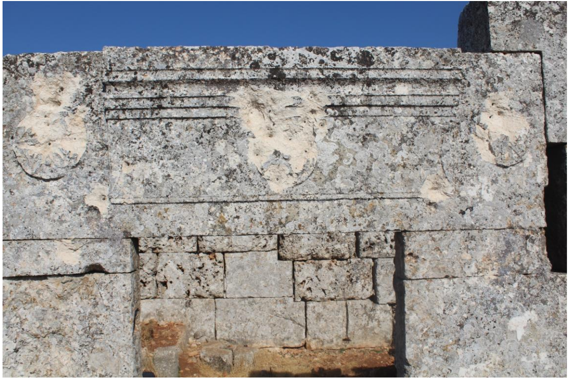
تهشيم ساكف مدخل البناء