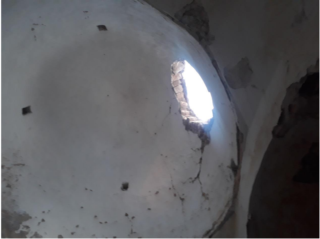
الأضرار التي لحقت حمام المالحة جراء الغارة الجوية