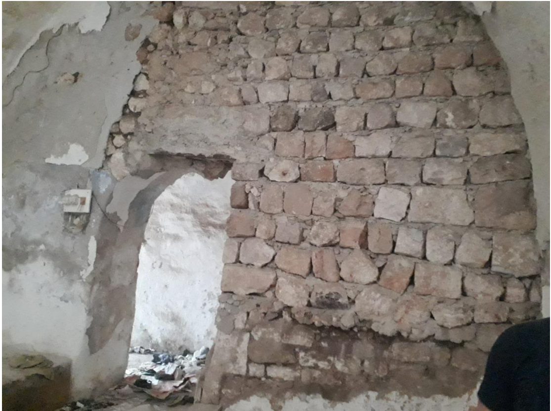
الأضرار التي لحقت حمام المالحة جراء الغارة الجوية