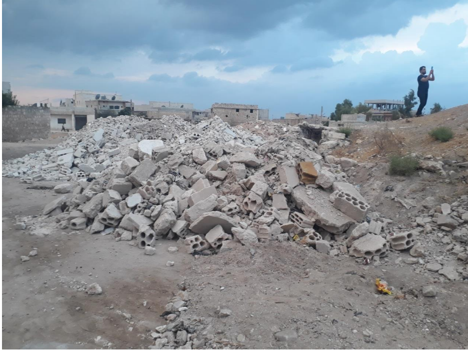
انقراض بحاجة لترحيل