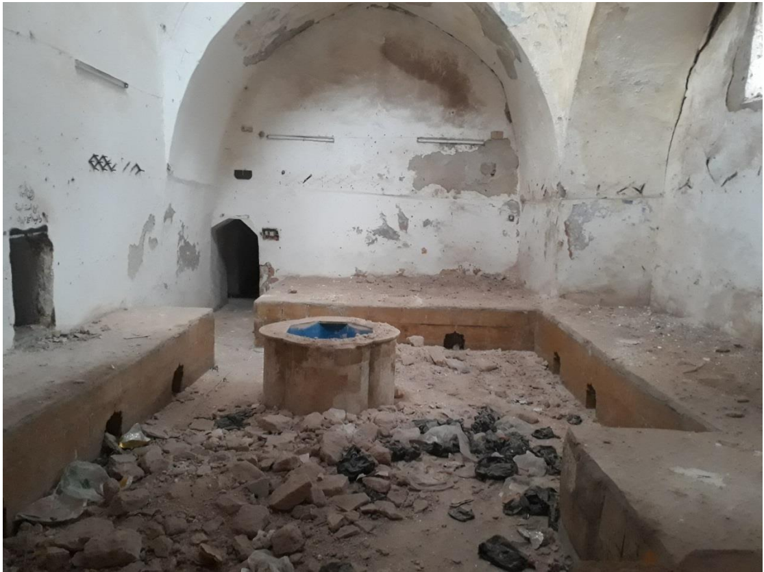
الأضرار التي لحقت حمام المالحة جراء الغارة الجوية