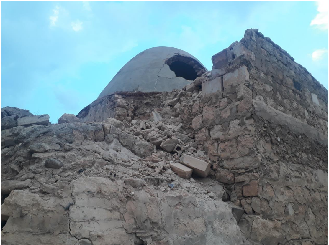
الأضرار التي لحقت حمام المالحة جراء الغارة الجوية