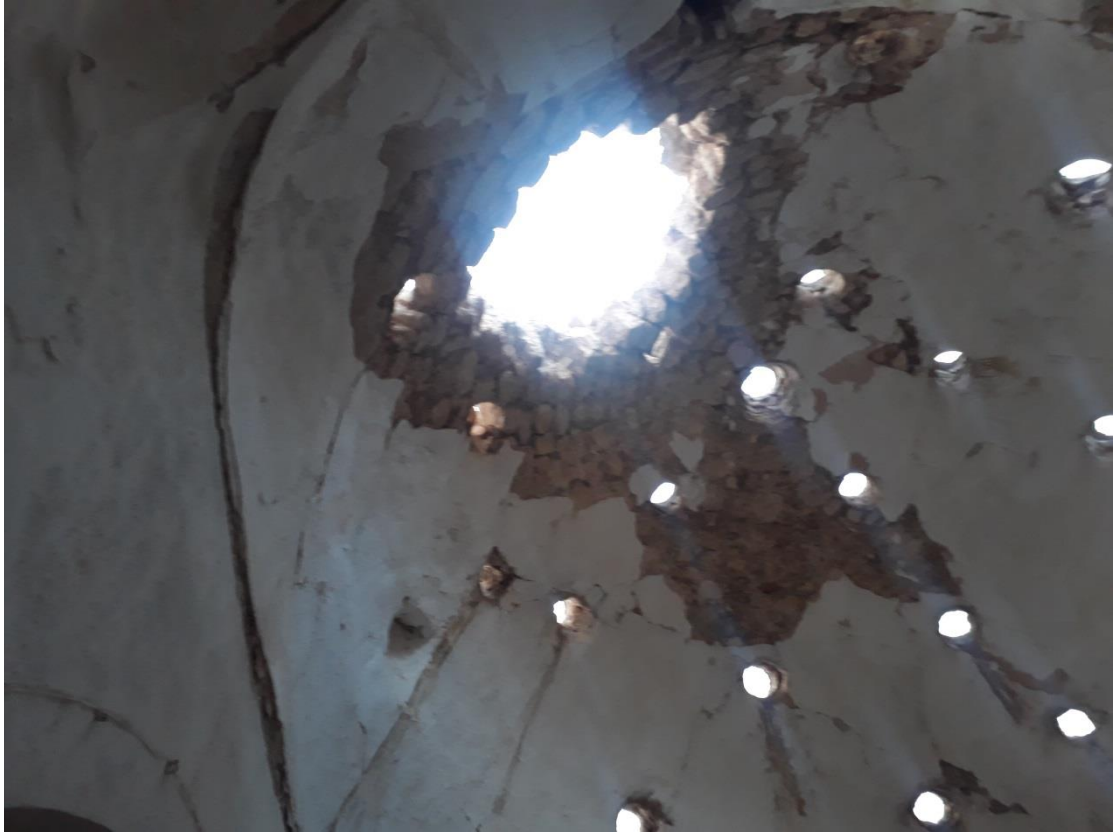
الأضرار التي لحقت حمام المالحة جراء الغارة الجوية