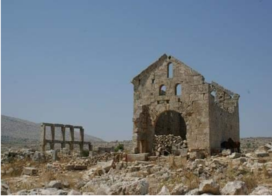
كنيسة ست الروم قبل التخريب