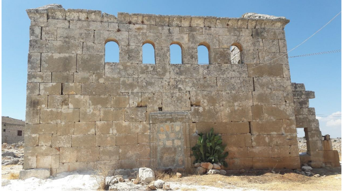
نلاحظ اغلاق أحد مداخل الكنيسة باستخدام الحجارة مع مادة الاسمنت من الجهة الجنوبية