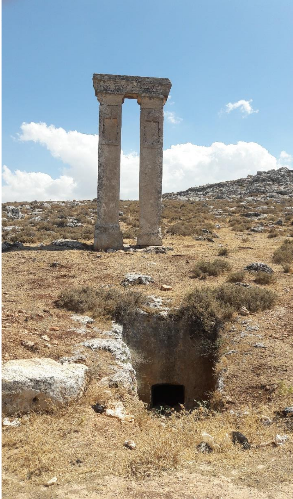
مدفن ايزودوتس الاثري مع العمودين في الأعلى