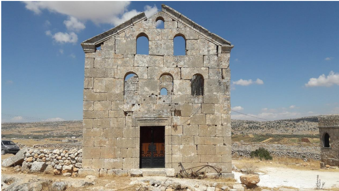
نلاحظ اغلاق أحد أبواب الكنيسة باستخدام باب من الحديد من الجهة الغربية