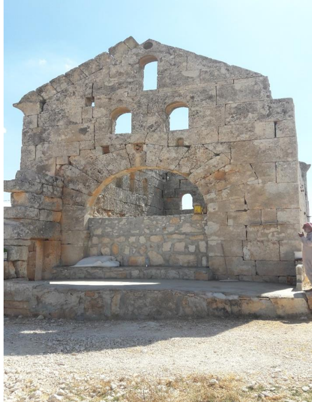
نلاحظ بناء جدار جديد مع المصطبة في الجهة الشرقية للكنيسة