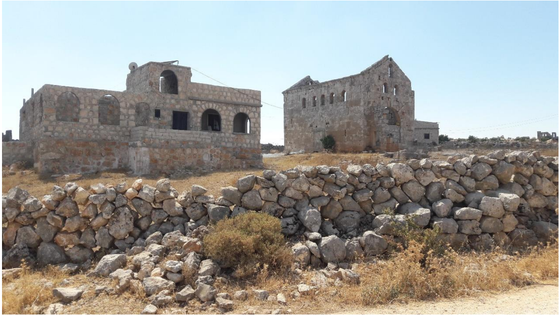
نشاهد البناء الجديد الى جانب الكنيسة من الجهة الجنوبية