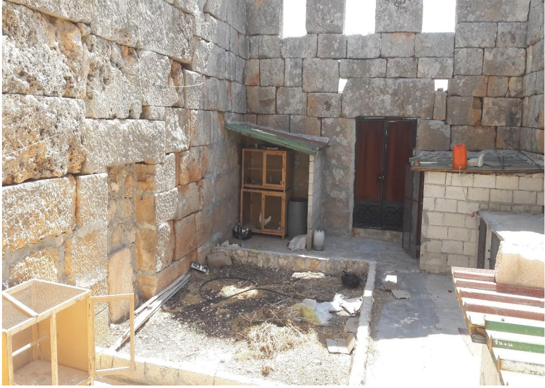
داخل الكنيسة القيام ببناء غرف صغيرة باستخدام مادة اللبن من اجل تربية الحمام والدجاج