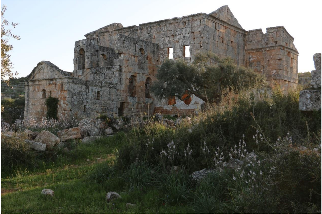
دير سوباظ من الجهة الشرقية