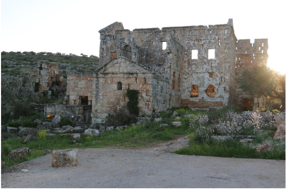
الواجهة الشرقية ويظهر عليها الأضرار الناتجة عن الطلق الناري