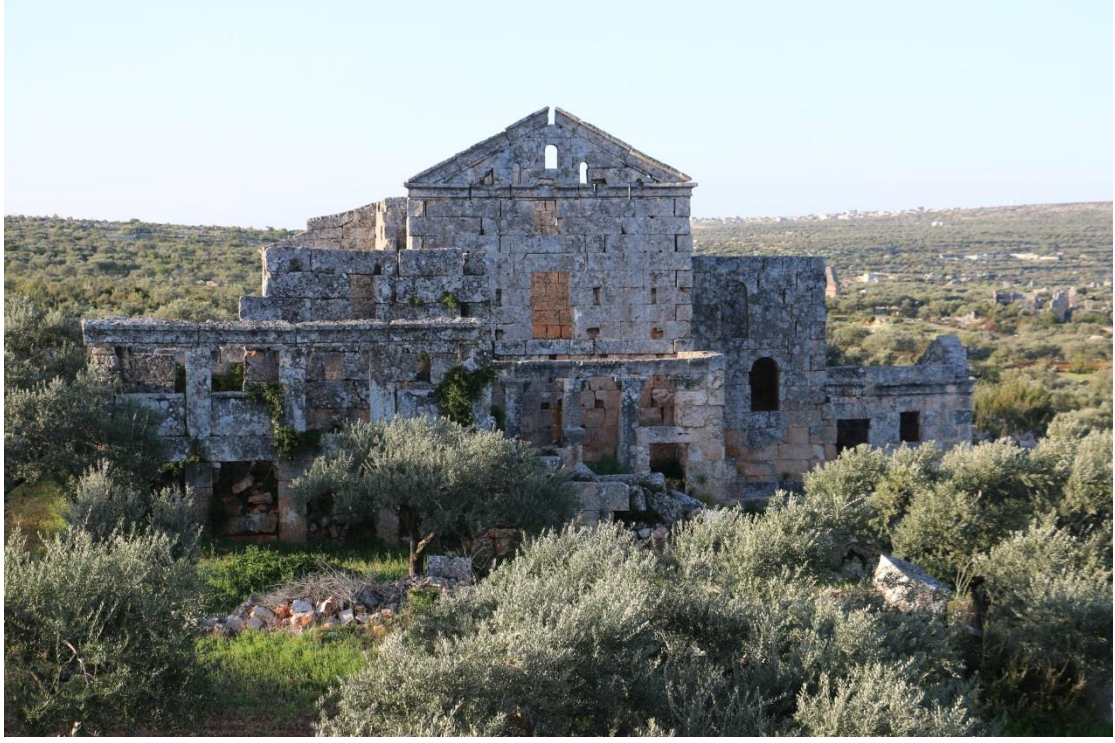
تكسير الأحجار وذلك لاستخدامها بالبناء الحديث