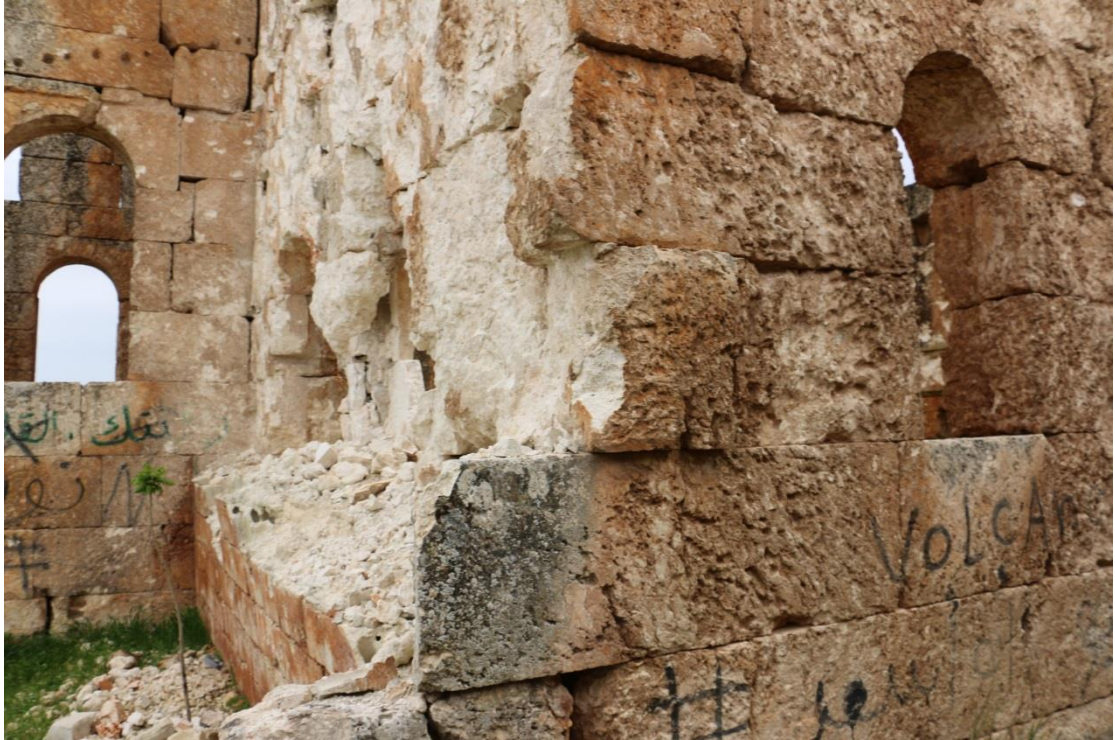
التخريب الناتج عن الطلقات النارية