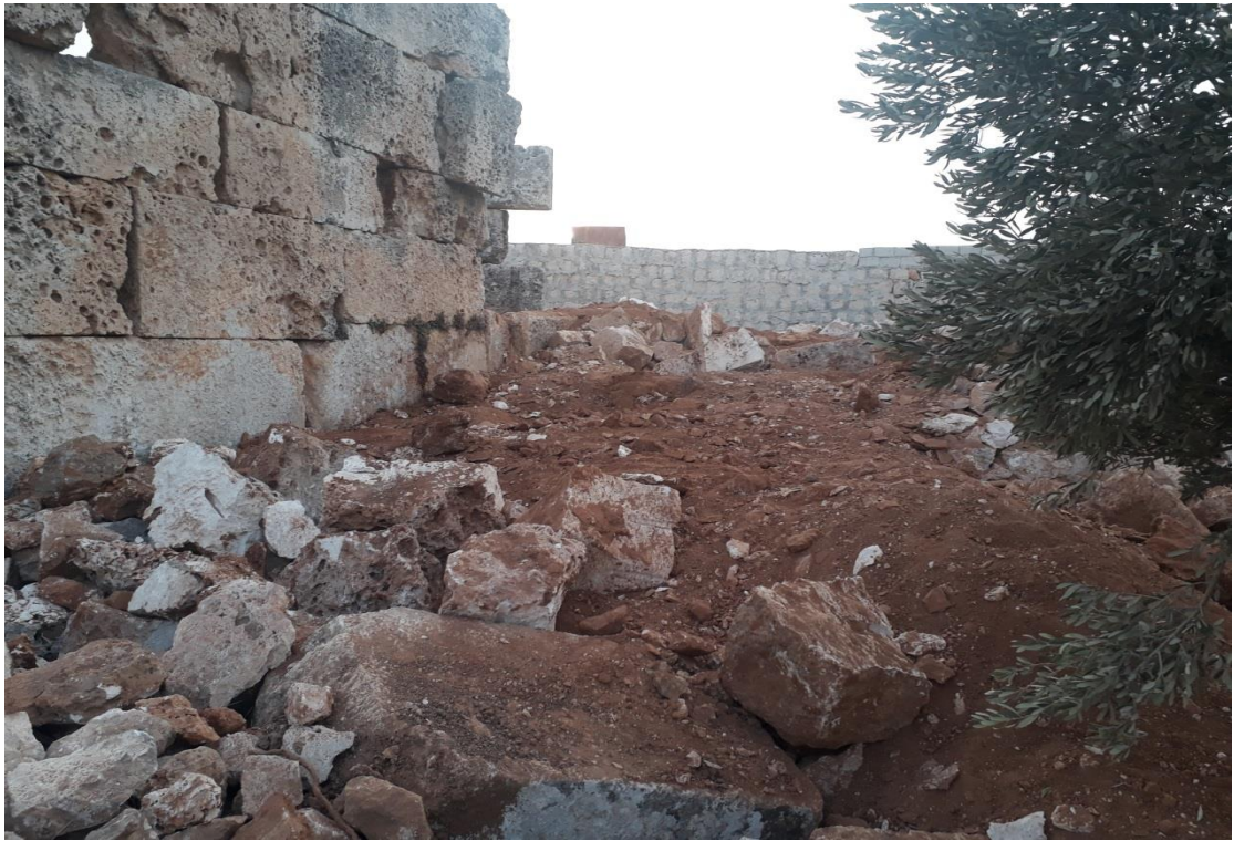
تنقيب غير شرعي في ارض الموقع