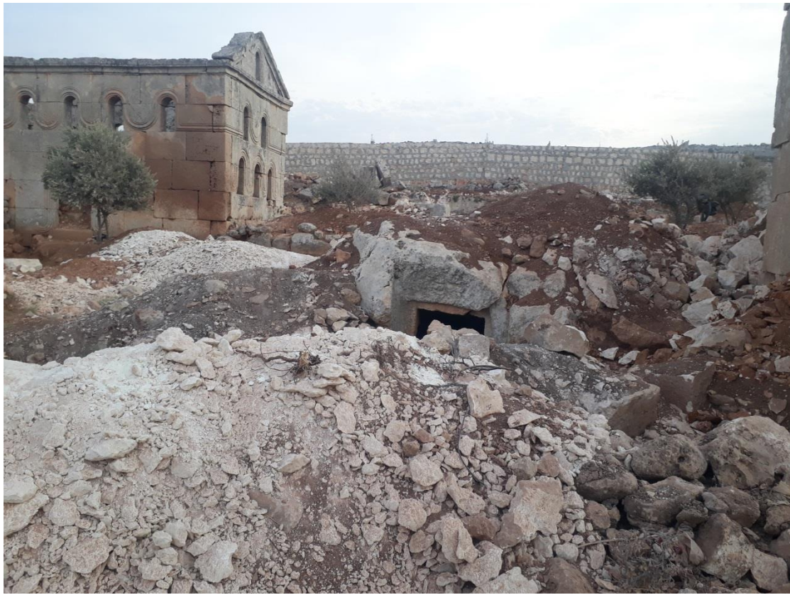
تنقيب غير شرعي في ارض الموقع وتكسير للأحجار