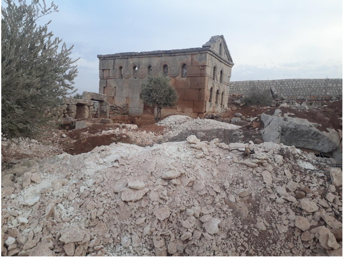
تنقيب غير شرعي في ارض الموقع وتكسير للأحجار