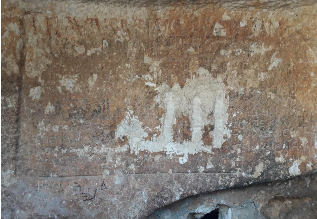
نلاحظ عملية تشويه الكتابة الموجودة فوق مدخل المدفن الاثري