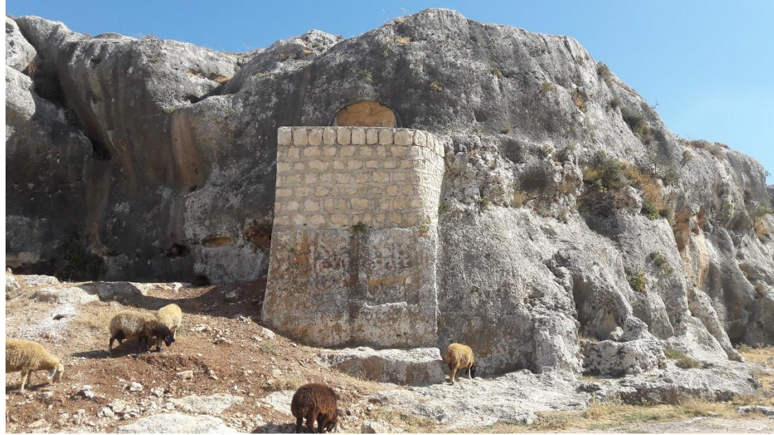
اعادة تهيئة احدى المدافن الاثرية من اجل السكن فيها وايضا استخدام بعض منها كزريبة للحيوانات