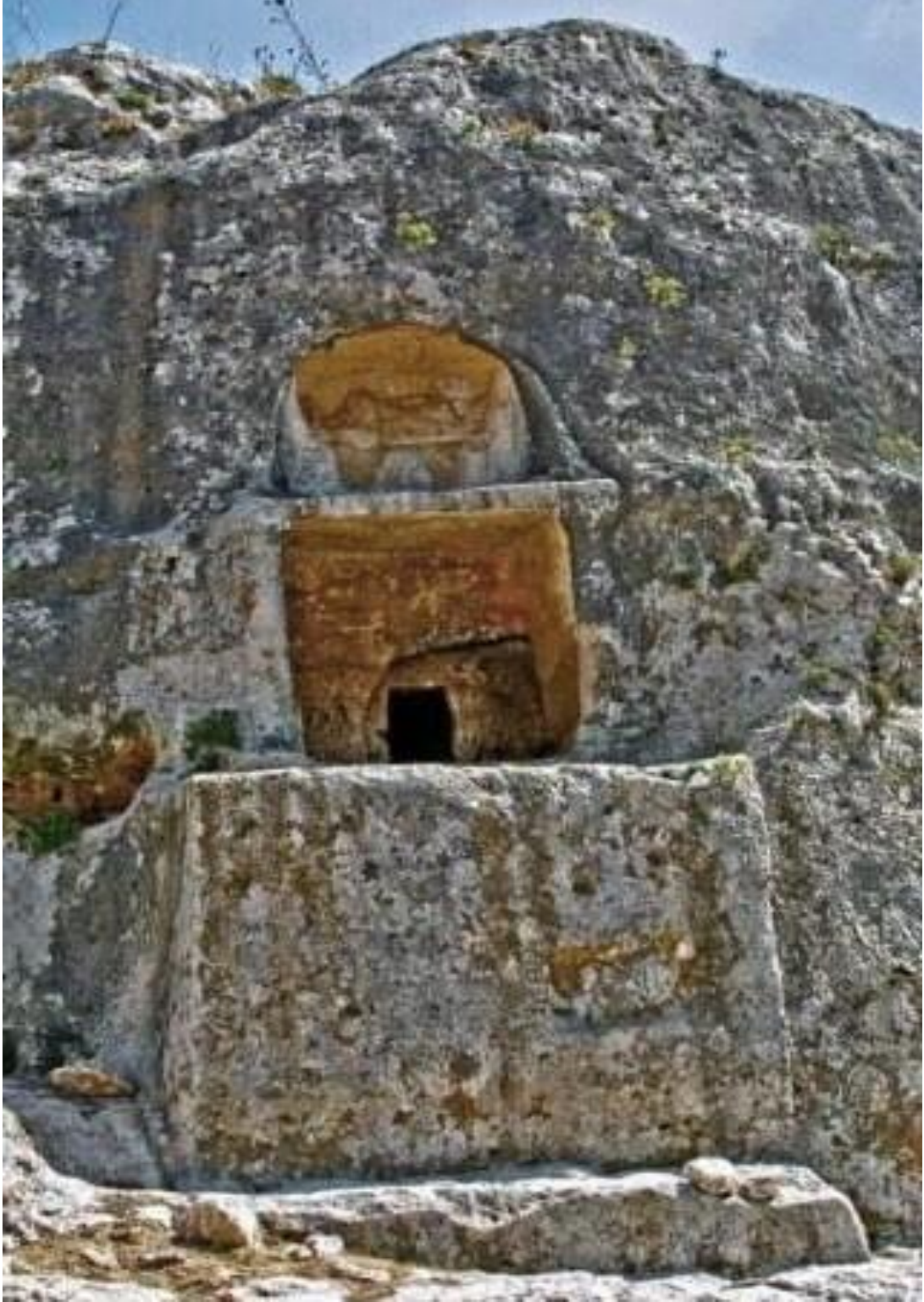
المدفن الغربي قبل التخريب

4- العمل على زيادة الوعي لدى المجتمع المحلي المحيط بالموقع الاثري لأهمية التراث الثقافي والتعاون من اجل حماية هذا التراث ويتم ذلك من خلال الندوات والمنشورات.