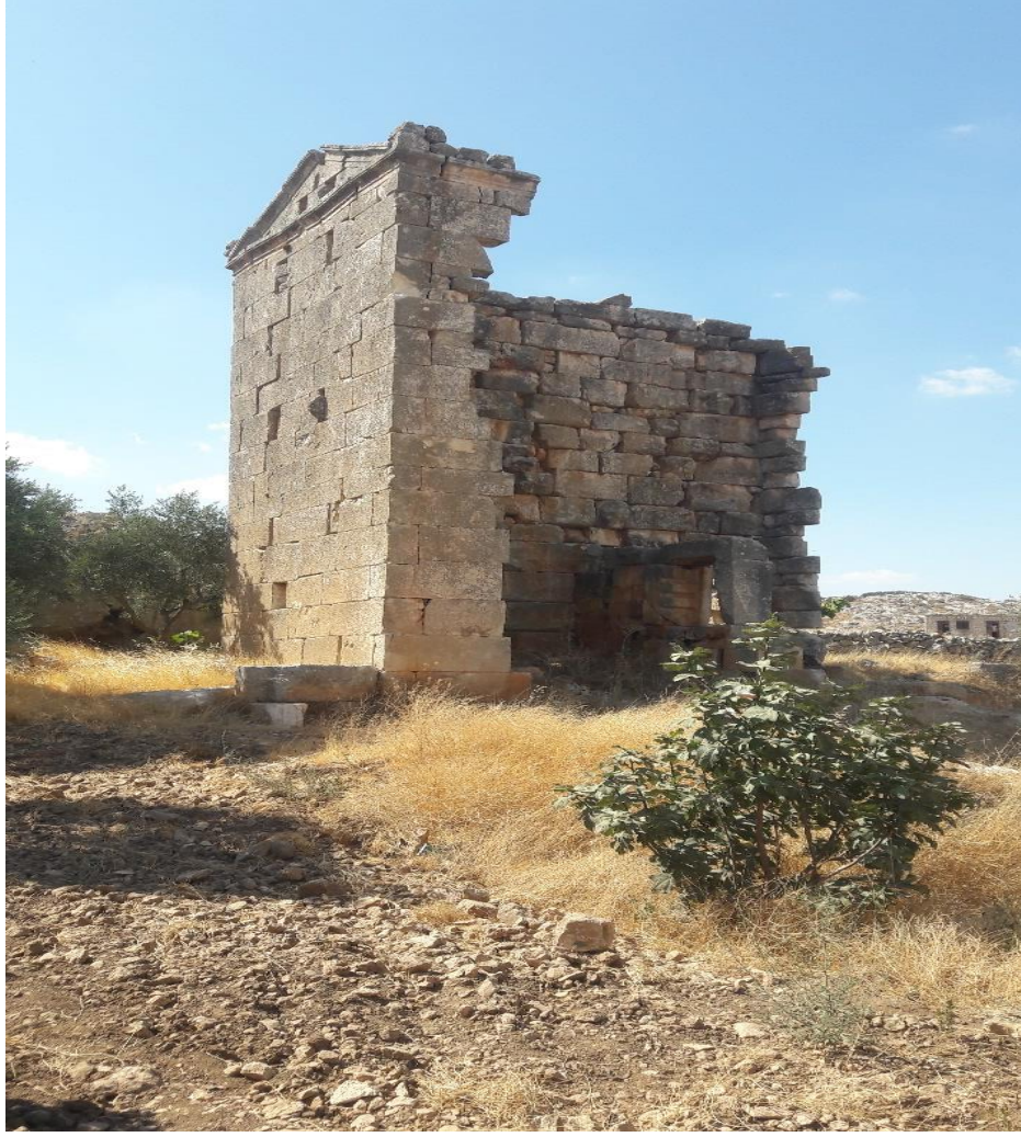
برج المراقبة في موقع قاطورة