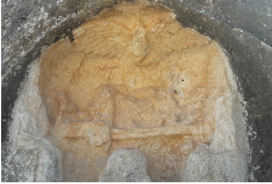
نلاحظ التشويه من خلال ازالة الرأس للشخص المنحوت على جانبيه وأيضا ازالة رأس النسر