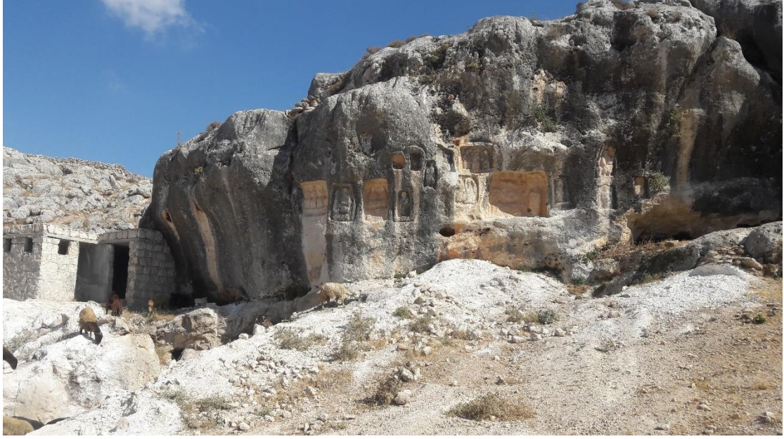
صورة عامة لتمثيل الموتى المنحوتة في الصخر