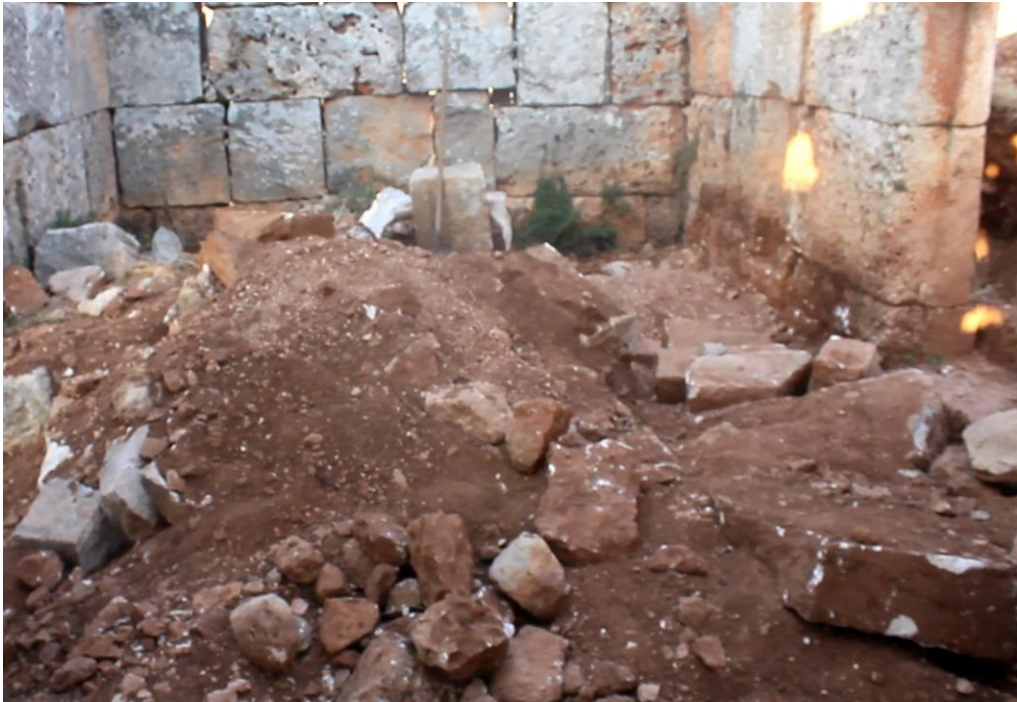
حفر أرضية البناء من الداخل