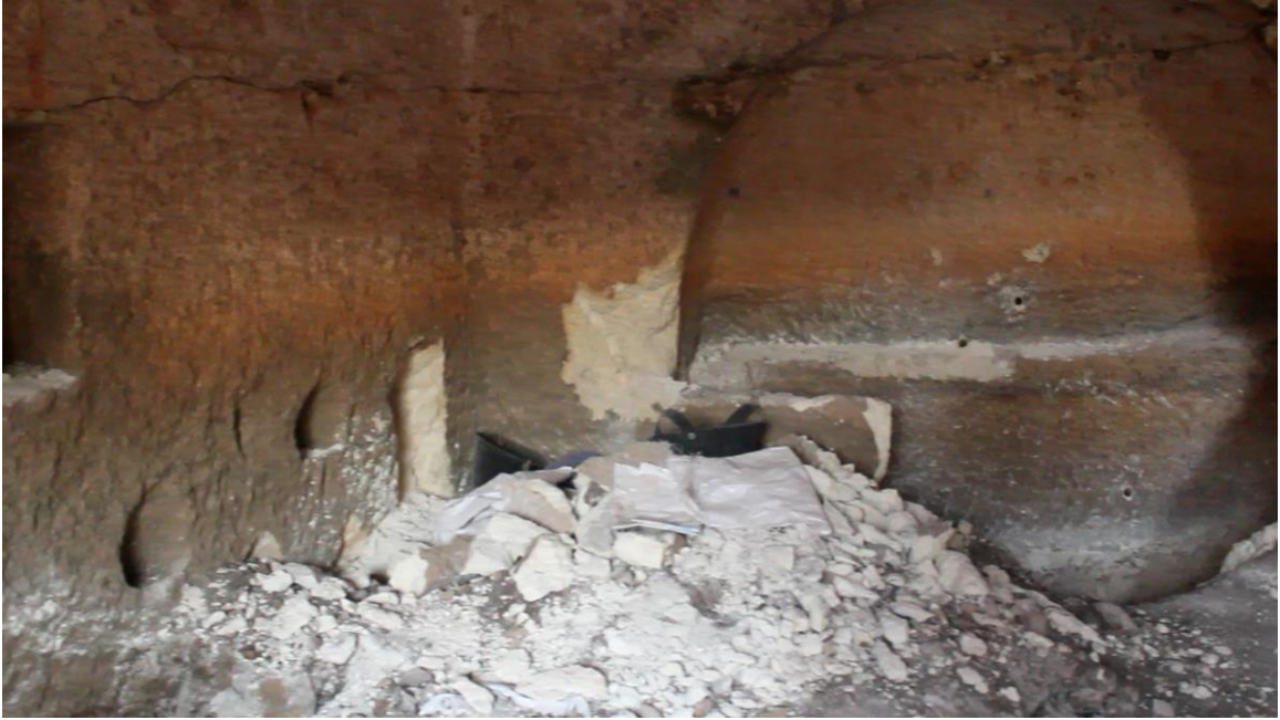
المدفن من الداخل يظهر ظهور نواويس تعرضت للنهب بأوقات قديمة