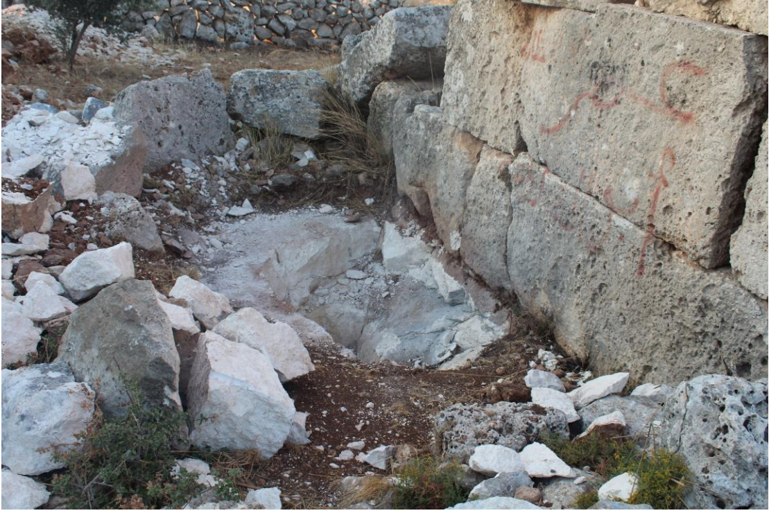
استخدام الديناميت في عمليات التنقيب

هذا البناء تعرض لعدد من عمليات التنقيب العشوائي والجائر استخدم في التنقيب اليات ثقيلة ومعدات تقنية حديثة مثل أجهزة كشف المعادن وقد أثرت بعض هذه التنقيبات على البنية الفيزيائية لأساسات البناء واستمرت هذه التنقيبات لمدة شهرين تقريبا دون معرفة نتيجة التنقيب