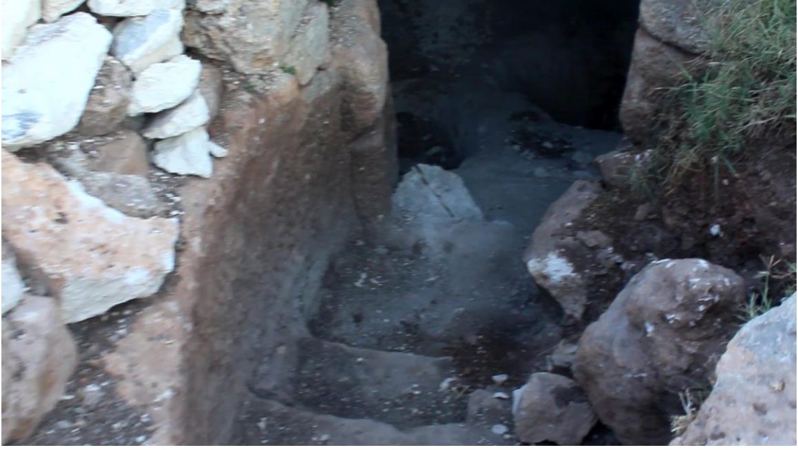
اكتشاف مدفن في حرم البناء