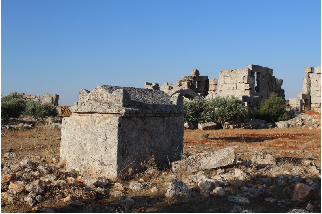
منظر عام للقريّة